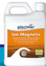
Ion Magnetic 1,2 kg

Élimine le chlore, le brome, ou l'oxygène actif immédiatement.