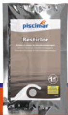
Resticlор 300 g

Das Kit enthält 3 Produkte: De kit houdt 3 producten in: The kit contains 3 products: