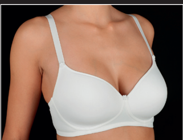
Camila C-D* C 85-110 D 85-105