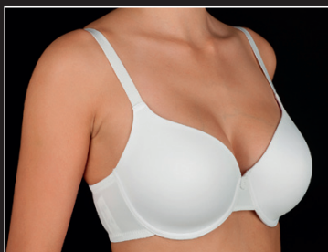
Aurora C-D* C 90-110 D 85-105