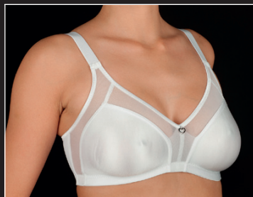
Estela C-D* C 90-115 D 90-115