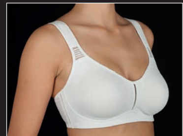
Elvira C-D C 90-115 D 85-110