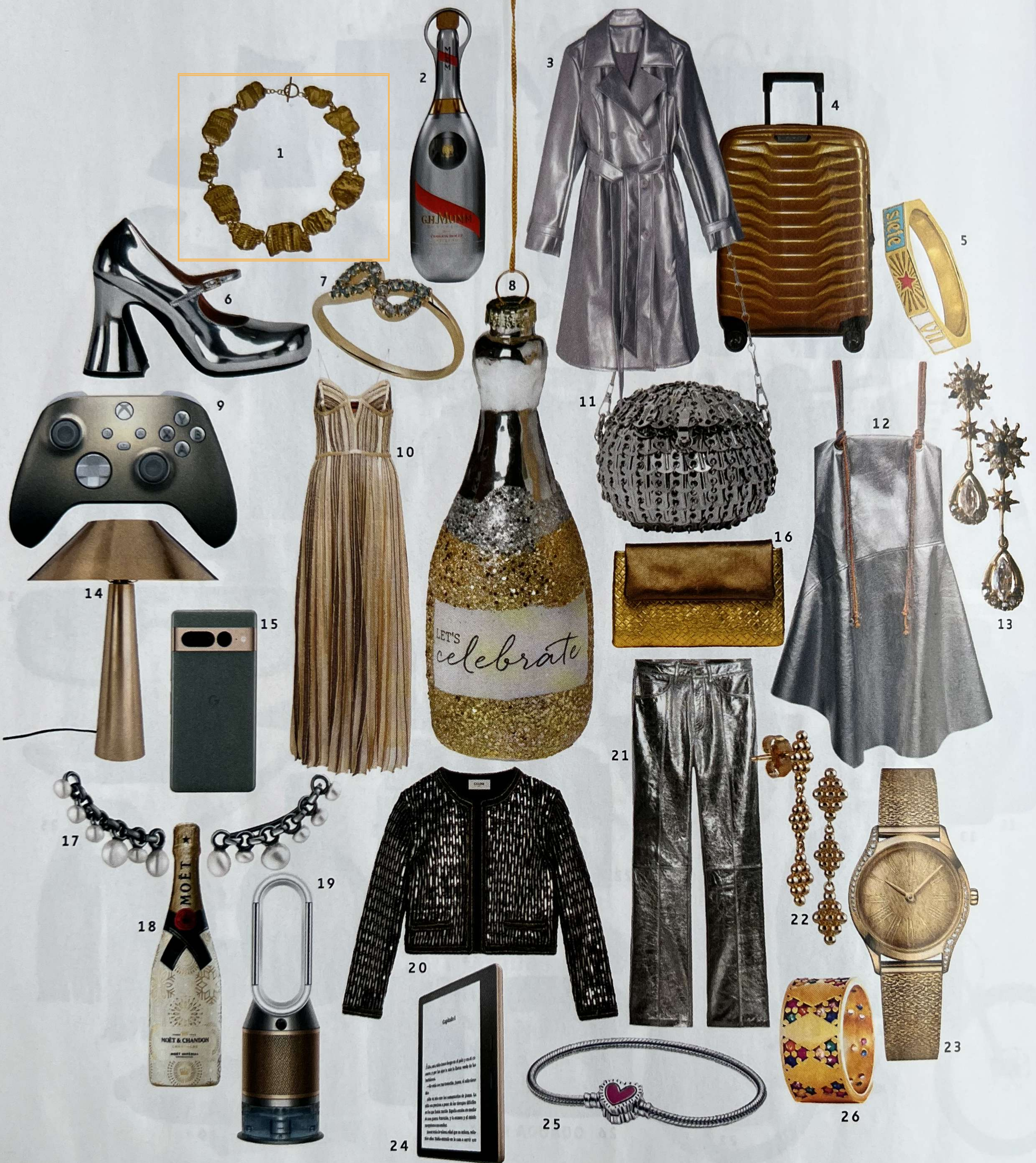
1. Collar Navigatio en latón bañado oro AUBAREDE7 (440 €). 2. Champán G.H. MUMM Cordon Rouge Stellar. 3. Gabardina ROBERTO VERINO (250 €). 4. Maleta cabina Proxis Spinner SAMSONITE (370 €). 5. Anillo Hit ARISTOCRAZY (89 €). 6. Mary janes piel MARNI (750 €). 7. Anillo Milos en oro y topacios BROWN&BLONDE (390 €). 8. Adorno árbol botella MuyMUCHO (6,99 €). 9. Mando Xbox Lunar (64,99 €). 10. Vestido dorado MISSONI (1.790 €), en Mytheresa.com. 11. Bolso PACO RABANNE (890 €). 12. Vestido metalizado de tirantes PARFOIS (39,99 €). 13. Pendientes M DE PAULET (260 €). 14. Lámpara Kyoto MAISONS DU MONDE (99,99 €). 15. Smartphone Pixel 7 Pro GOOGLE (899 €). 16. Cartera piel Lisboa MONA MOON (80 €). 17. Pendientes de plata y perlas TOUT (119 €). 18. Botella champán personalizada MOËT CHANDON Imperial (43,50 €). 19. Purificador y humidificador de aire (799 €). 20. Chaqueta cárdigan paillettes CELINE (18.000 €). 21. Pantalón Poete de piel ZADIG&VOLTAIRE (745 €). 22. Pendientes Racimos VIDAL&VIDAL (46 €). 23. Reloj Mini Trésor en oro OMEGA (25.200 €). 24. Libro electrónico KINDLE OASIS AMAZON (279,99 €). 25. Pulsera plata Keith HaringxPANDORA (89 €). 26. Anillo Amelia THE GLAB JEWELS (53 €).