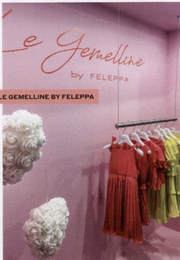
LE GEMELLINE BY FELEPPA