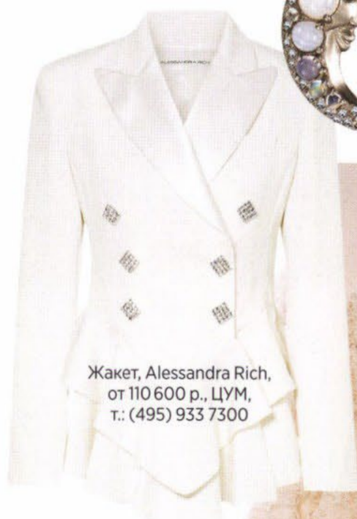
Жакет, Alessandra Rich, от 110 600 р., ЦУМ, т.: (495) 933 7300