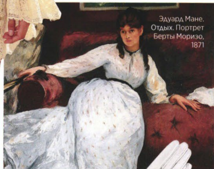
Эдуард Мане. Отдых. Портрет Берты Моризо, 1871