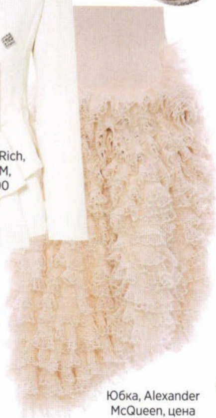
Юбка, Alexander McQueen, цена по запросу, бутик Alexander McQueen, т.: (495) 933 3373