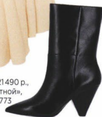
Ботильоны, ASH, 21 490 р., универмаг «Цветной», т.: (495) 737 7773