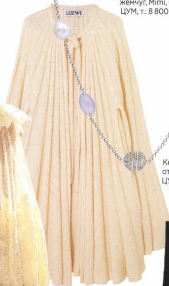
Колье Boutique, золото, бриллианты, халцедоны, жемчуг, Mimi, 626 250 р., ЦУМ, т.: 8 800 700 0800