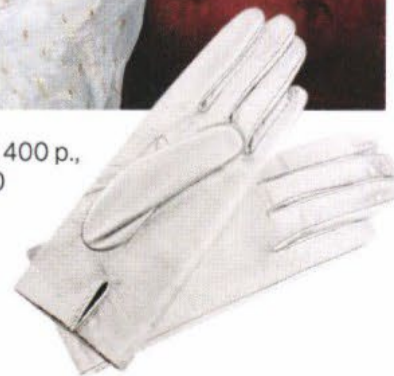
Перчатки, Dries Van Noten, 21 400 р., ЦУМ, т.: (495) 933 7300