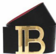
Ремень, Balmain, 47 900 р., бутик Balmain, т.: (495) 225 8853