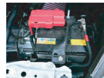
17. 最後にバッテリー端子とブラケットを取り付けます。