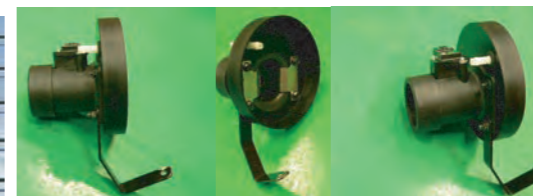
8. 写真のようにセンサーアダプターにセンサーを外したボルトで取り付け、アダプター・ステア・整流フィンを組み込みます。