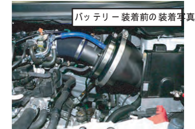
15. エレメントを後から取り付けるクリアランスが無い場合、必ずアダプターにクリーナー-ASSYを取り付けてからE/Gルーム内に入れスロットルに固定します。