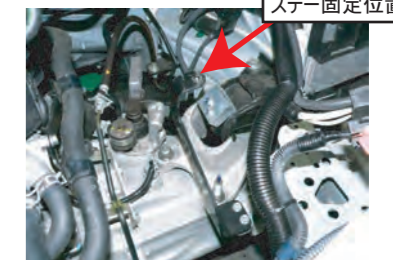
12. クリーナーケースを固定していたブラケットにステアを取り付けます。