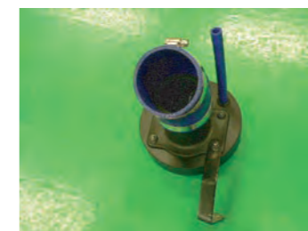
11. センサーアダプターにホースを取り付けます。(径が大きい方がセンサーアダプター側に取り付け) 次にアダプターにクリーナー-ASSYを取り付けます。