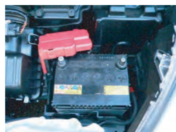
2. バッテリー端子とブラケットを取り外します。