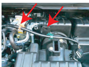
4. エアフロセンサー、カバーと配線クリップを2箇所取り外します。同時にブローバイホースも外します。