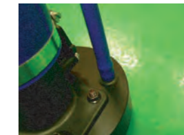
9. ホースを差し込みます。