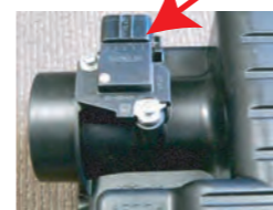
7. クリーナーケースからエアフロセンサーを取り外します。