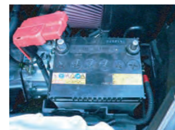
16. バッテリー裏の配線ブラケットを戻しバッテリーを取り付けます。