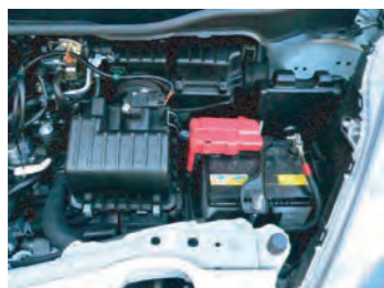
1. クリーナーケースを取り外します。