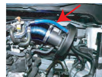
14. ブローバイホースを取り付け、エアフロカバーも元に戻します。