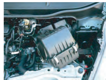
6. 写真のようにクリーナーケースを取り外します。