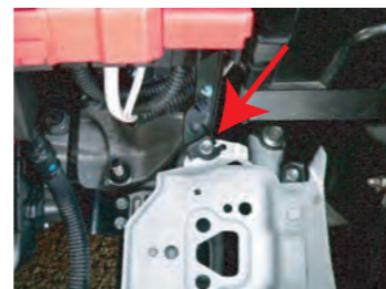
3. バッテリー本体を外し配線を固定しているブラケットのボルトも一度取り外します。