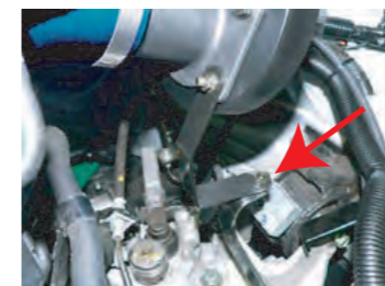
13. アダプター-ASSYのエルボウホースをスロットルに差し込み、ステアで固定します。