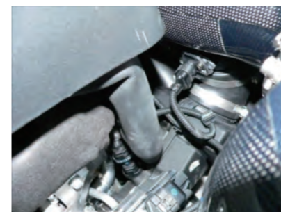
センサーカプラーを取り付けます。