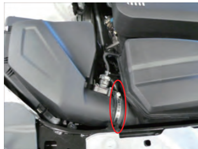
ホースバンドを緩めます。