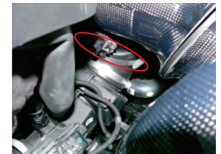
センサーアダプター部をエルボウホースに差し込み、バンドで締め付けます。