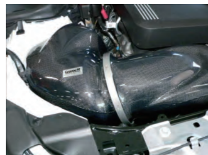
Vクランプでフィルターケースとチャンバーケースを固定します。