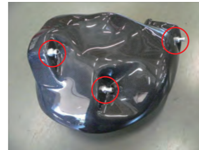
アルミスタッドをビスB3本でフィルターケースに固定します。