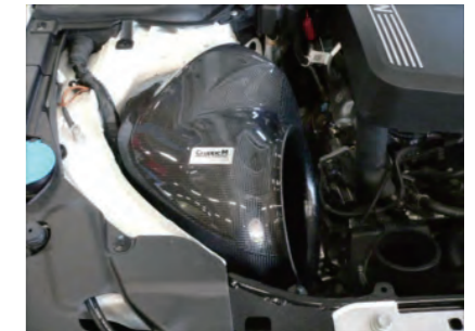
フィルターケースを配置します。