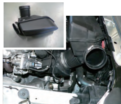
レゾネーターボックスを取り出します。