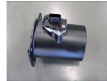
センサーアダプターに吸気温度センサーをM4スペーサーを挟み、ビスC2本で固定します。