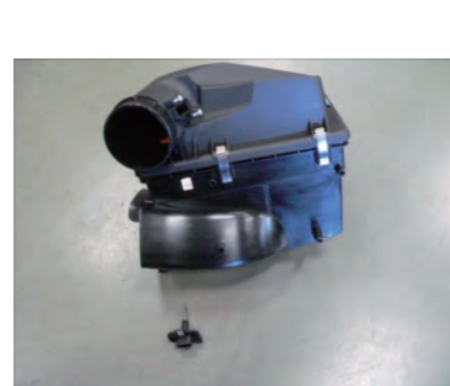
ボックスから吸気温度センサーを外します。