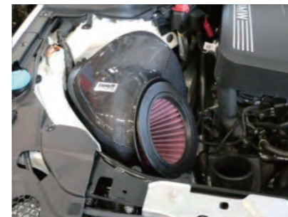
フィルターを配置します。