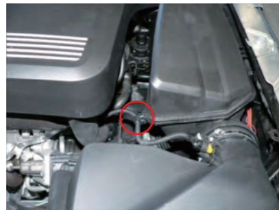
配線留を外します。