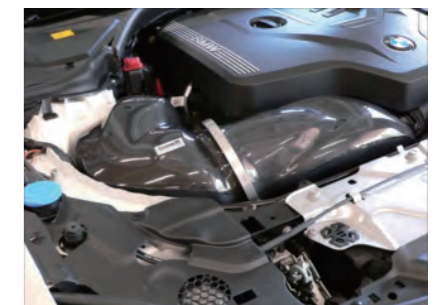
各部増し締めを行い作業完了です。