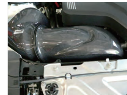
カーボンチャンバーケースを配置します。