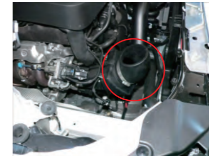
エルボウホースを取り付け、付属のホースバンドで締め付けます。