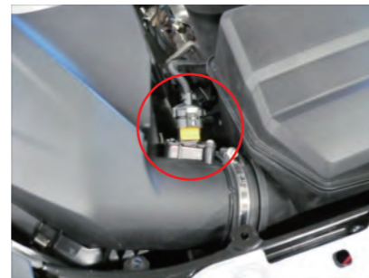
センサーカプラーを外します。