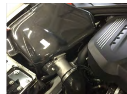
カーボンケース車両に配置します。