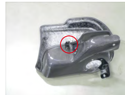
カーボンケースにステーをビスAで仮留めします。