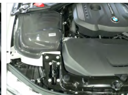
グリル・パネルを戻し、各部増し締め確認を行ってください。