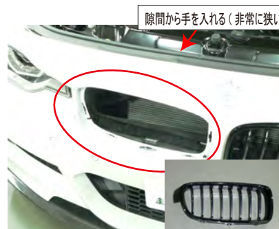
右側のグリルを外します。バンパー上面を外し、隙間から手を入れてグリルのツメを押して外す。※困難な場合はバンパーごと外す。