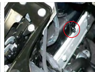
ワッシャーを挟みカーボンをビスAで固定します。