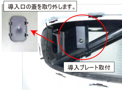
プラケットを使用して導入プレートをビスCで固定します。