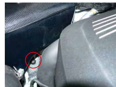
ステーを純正ボルトで固定します。