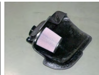
フィルターを取り付けます。