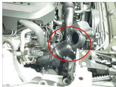
サククションホースを外します。