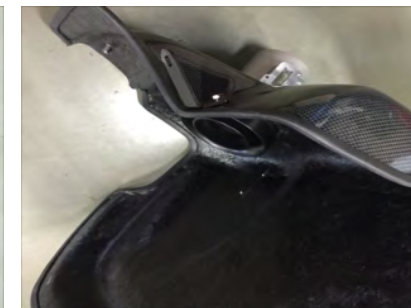
カーボンケースにファンネルアダプター・吸気管アダプター・エアマスアダプターをビスBで取り付けます。