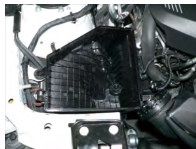
エアークリーナーボックス下部を外します。