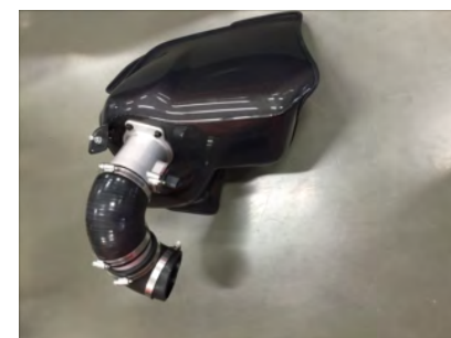
エアマスアダプターにホースとパイプを組み込みます。