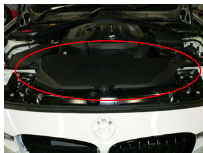
パネルを外します。