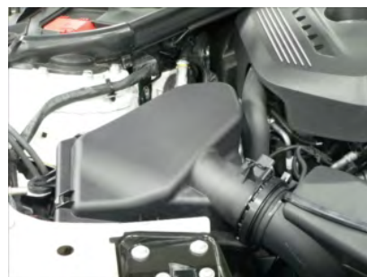
エアマスセンサーカプラーを外してエアークリーナーボックス上部を取り出します。