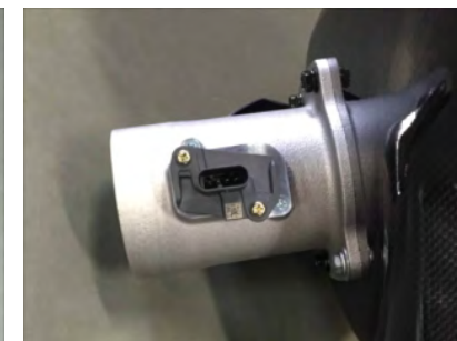
エアマスアダプターにスペーサーを挟み、ビスDでセンサーを取り付けます。