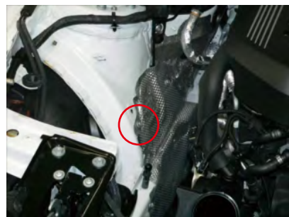
ボルトを外します。