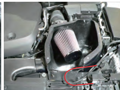
カーボン導入ダクトを一旦外し、カーボンボックスを車両に配置します。ワイヤーをカーボンボックスの下に挟まないように注意してください。