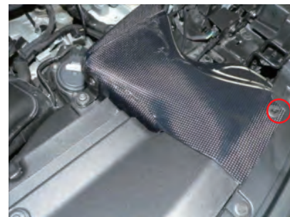
カーボン導入ダクトを車両に配置し、クリップで仮固定します。