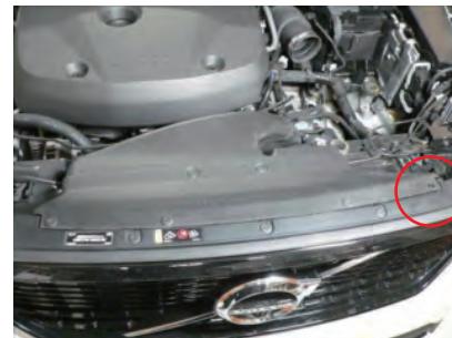
導入パネルを戻します。丸印のクリップは取り付けしないでください。