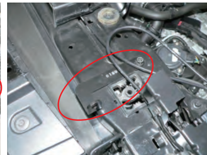
ステー 0510 をビスAとナットでボディに仮締めします。