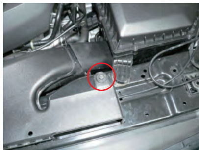
ボルトを外します。