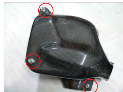
カーボンリッドを外し、ビスBでアルミスタッドをカーボンボックスに固定します。