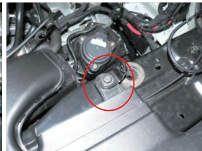
ステー T0303 を取り外した純正ボルトで仮締めします。