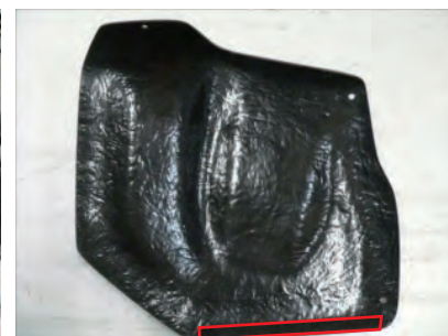
上図位置にパッキンテープをカットして貼り付けます。