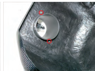
ビスCでエアフロアダプターを固定します。