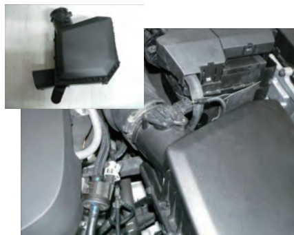
センサーカプラーを外し、サクシオンホースバンドを緩めます。エアボックスを取り出します。