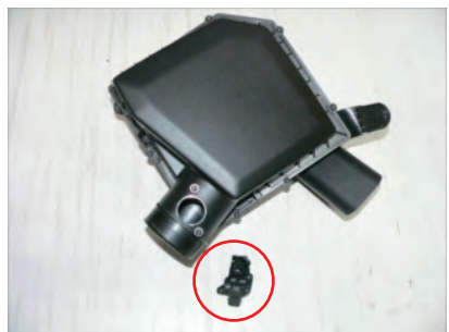
エアマスセンサーを外します。