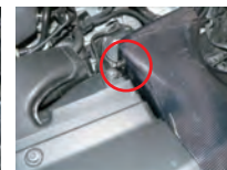
カーボン導入ダクトをステーで固定できる位置に微調整をして、ステーのボディ側ボルトを本締めします。