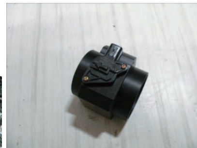
エアフロアダプターにスペーサーを挟み、ビスDでエアマスセンサーを取り付けます。