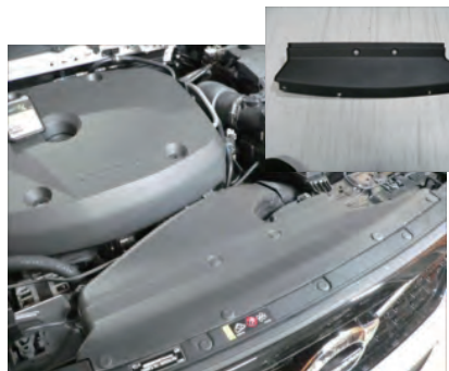
導入パネルを外します。