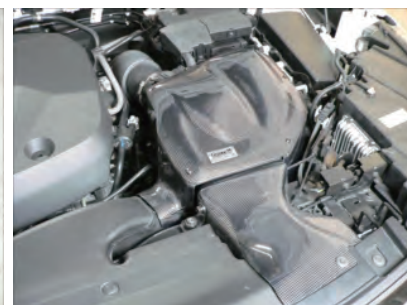
カーボンリッドを取り付けます。センサーカプラーを差し込み、サクシオンホースバンドを締めます。各部増し締めして作業完了です。