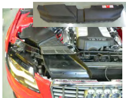
ラジエター上部のパネルを外します。