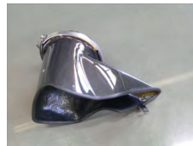
クリーナーASSYをアダプターに組み付けます。