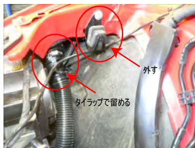
ノーマルクリーナーケースブラケットを外します。エアポンプフィルターをフェンダー側の奥側にタイラップで留めます。