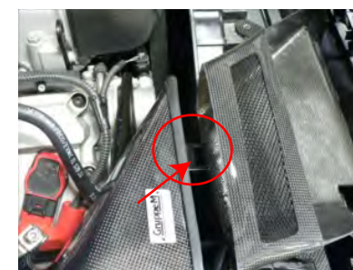
導入ダクト取り付け、カーボンケースのフックをダクトの中に載せるように配置します。