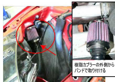
フィルターに付属オイル塗布します。エアポンプホースにフィルターを差し込み、外側からバンドで取付けます。