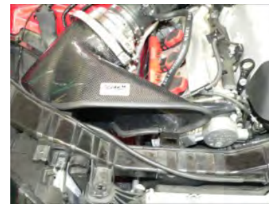
クリーナーASSYをサクシジョンホースに差し込み、バンドで仮取り付けます。