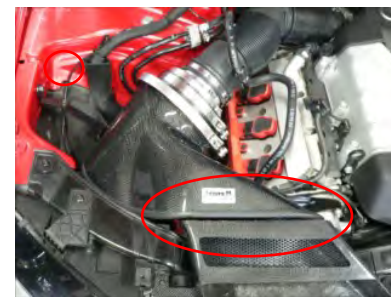
導入ダクトとフィルターケースの位置が合うようにステーの角度を微調整しながら固定していきます。