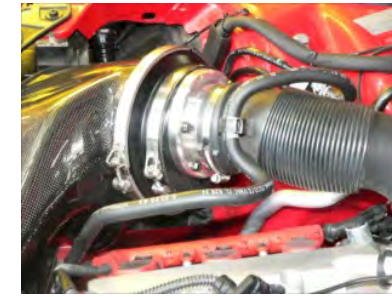
クリーナーASSYをサクシジョンホースに差し込みます。ジョイントアダプターが上方になるように組み付けます。