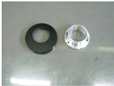
アダプターにジョイントアダプターを取り付けます。