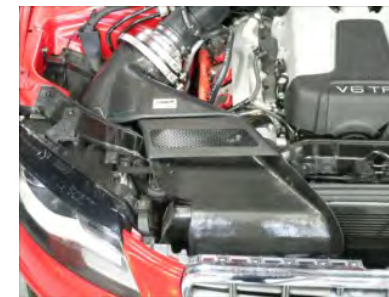
位置が決まったら、各部増し締めします。