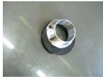
ビスC(M6-30)、ナットで組み付けます。