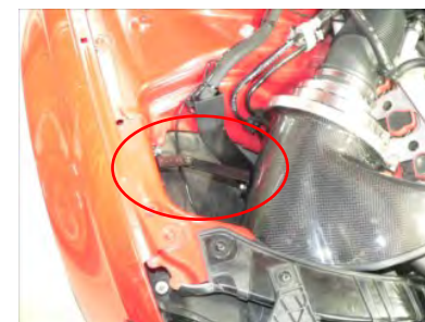
カーボンケースをステーでボディに固定します。