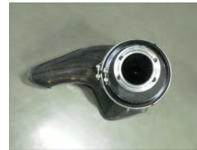
写真のように、ジョイントアダプターが上方になるように組み付けます。