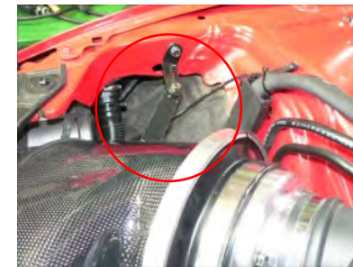
ボディ側はノーマルクリーナーケース固定ブラケットが付いていた孔に取り付けます。ビスB(M6-20)使用