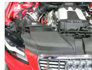
ノーマルのパネルを元の通りに取り付けます。