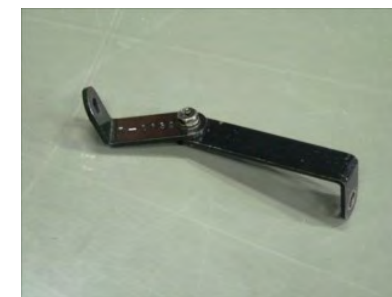
写真のように、ステー-0028とT0139を連結させ、組み付けます。ビスA(M6-15)、ナット使用