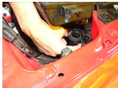
エアポンプホースを外し、ノーマルクリーナーボックスを引き上げて外します。