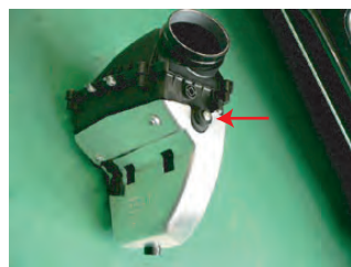
ボックス奥側は、ブラケットのU部に乗っかるように固定されています。