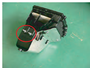
ボックス手前側は、ブラケットに刺さるように固定されています。