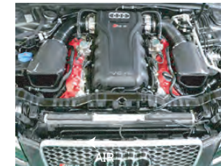
左右、同様に取り付けます。(ボックス本体はステー固定はしません)