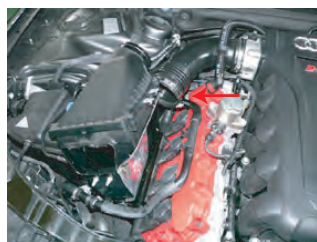
バンドを緩めて、ボックスの奥側を上方に引き上げて取り外します。