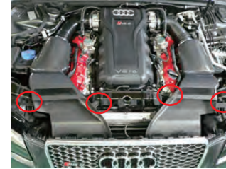
導入ダクトをボックスに差し込み、配置してステーで固定します。