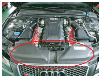
フロントカバーを取り外します。