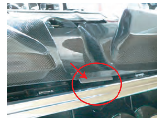
カーボンフロントカバーのツメをグリルに引っかけて配置します。