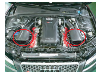
カーボンボックスをエンジンに配置して、サクシジョンホースに差し込み、バンドで締めます。