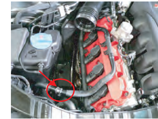
ホースクランプはカーボンボックスの取り付け時に、干渉するので取り外すか、下向きにします。