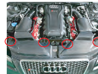
カーボンフロントカバーをノーマルのクリップで取り付けます。