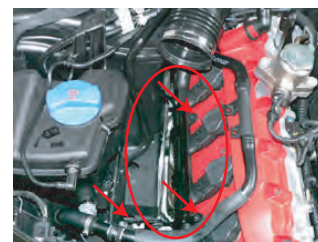
矢印部のネジを外し、クリーナーボックスの固定ブラケットを取り外します。