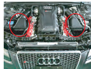
左右のクリーナーボックスを取り外します。