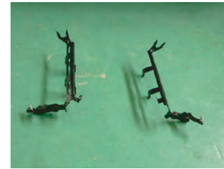
クリーナーボックスの固定ブラケットを左右とも取り外します。