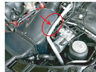
アルミ管とカーボンボックスの間に、クッションテープを貼り付けます。