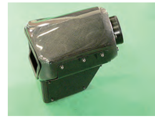
フィルターボックスのボルトを増し締めします。