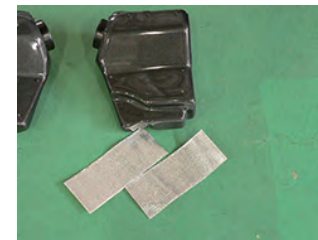
カバー部、底部に耐熱マットテープを貼り付けます。(片側に2枚使用)