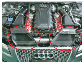
ノーマルの導入ダクトを左右取り外します。