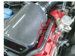
ホース固定ブラケットが干渉する所にクッションテープをカットして貼り付けます。