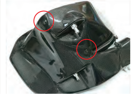
12. チャンバーケースとフィルターケースをビス E を 2 本使用して固定します。