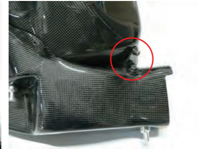
14. チャンバーケースとフィルターケースをビス A で固定します。8.12.13.14 の工程のビスを各部増し締めをします。