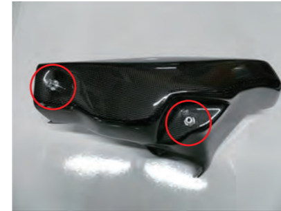
7. アルミスタッド 2 個をビス B2 本で固定します。