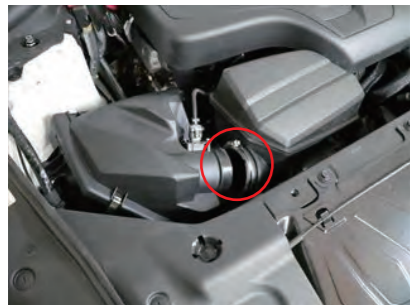
1. ホースバンドを緩め、クリーナーボックスからサクシジョンホースを外します。