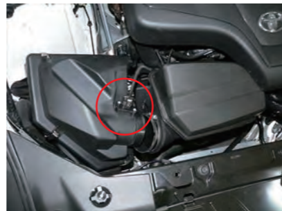
3. センサーカバーを外します。