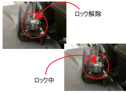
2. センサーの白い部分を上に持ち上げロック解除します。