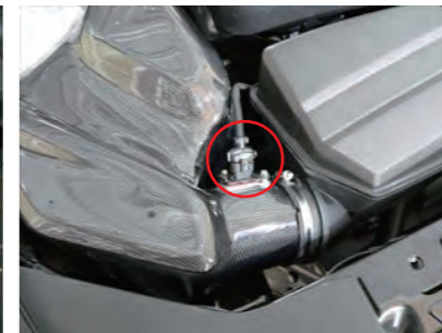
17. センサーカバーを取り付け、ロックをします。