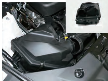
4. クリーナーボックスを上を持ち上げ取り外します。