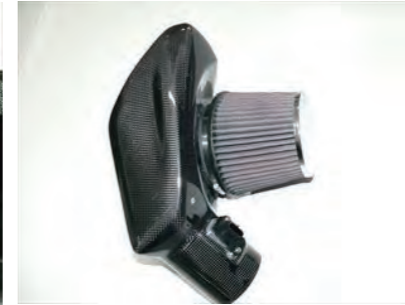
11. フィルターをバンドで固定します。