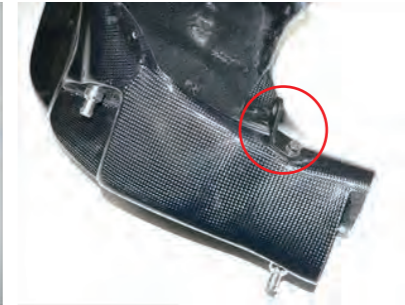
8. ビス A でステーを仮止めします。(ステーは左右対称です。)