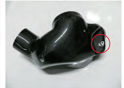
9. アルミスタッドをビス B で固定します。必ず増し締めを行ってください。