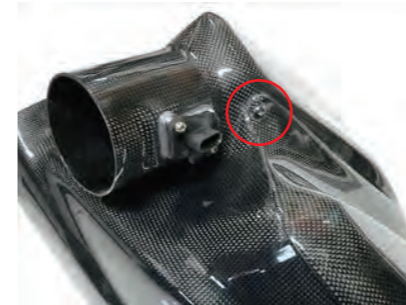
13. チャンバーケースとフィルターケースをビス E で固定します。