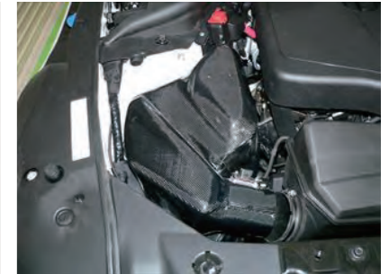
15. カーボン ASSY のアルミスタッドがグロメットにしっかりと 3 箇所刺さるように配置します。