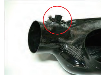
10. センサーと台座の間に M4 スペーサーを 2 個挟み、ビス C2 本でセンサーを固定します。