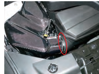
16. チャンバーケースにサクシジョンホースを取り付け、ホースバンドを締めこみます。