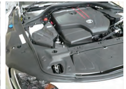
18. 各部増し締めを行い作業完了です。