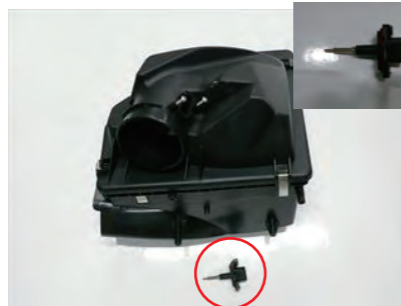
5. クリーナーボックスからセンサーを取り外します。