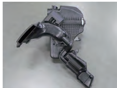
6. エアボックスからフレッシュエアガイドを取外します。