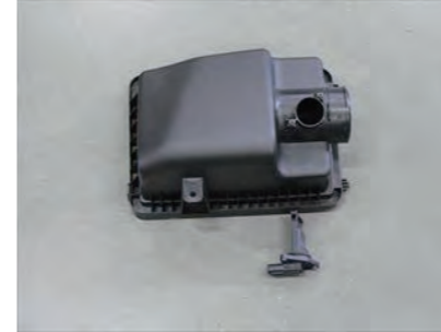
7. エアボックスからセンサーを外します。