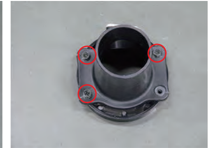
9. エアフロアダプターとアダプターをビス Ax3 を使用して赤丸の位置を固定します。