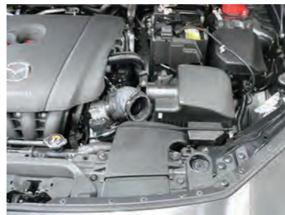
3. サクションホースバンドを緩め、エアボックスから外します。