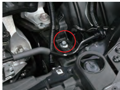
5. ボルトを外します。