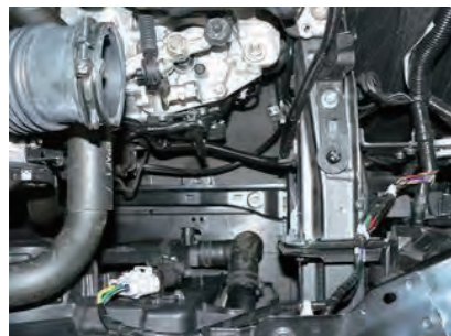
4. エアボックスをフレッシュエアガイドごと取外します。