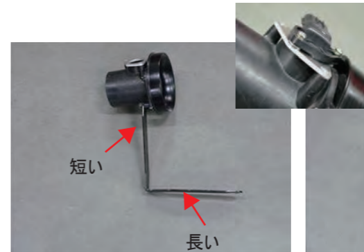
10. スペーサー 10mm を挟み、エアフロアダプターにビス B を使用してステアを固定します。