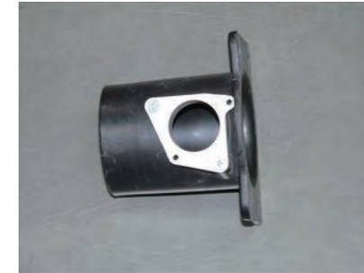
8. エアフロアダプターに皿ビス x2 を使用して変換プレートを取付けます。