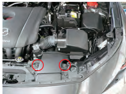
1. フレッシュエアガイドのボルトを2本外します。