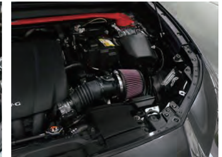
15. フレッシュエアガイドを元に戻します。