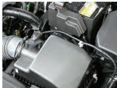
2. センサーカバーと配線止めを外します。