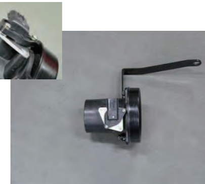
11. ワッシャー x2 を挟みセンサーをビス Dx2 を使用して固定します。