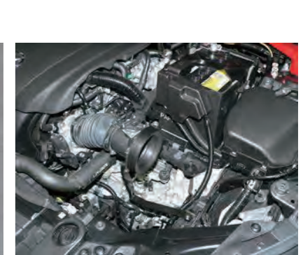
12. アダプター ASSY をサクションホースに取付けます。