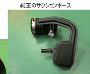
純正のサクシジョンホース