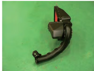
導入ダクト側のケースを取り外します。