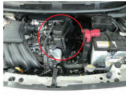
サクシジョンホース側のケースを取り外します。