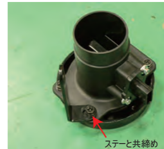
センサーアダプターにステーを共締めで取り付けます。