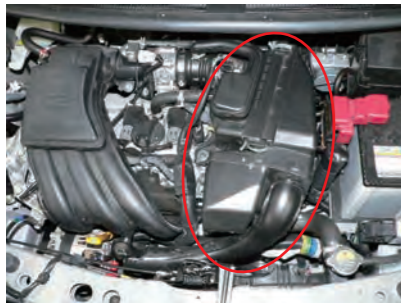
クリーナーケースを取り外します。