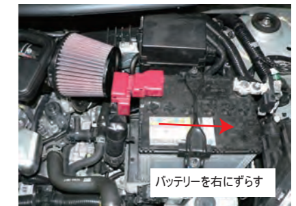
アダプターにフィルターを取り付けます。フィルターとのクリアランスが無いので、バッテリーを右にずらしてください。