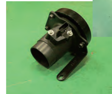
センサーアダプターに純正ケースから外したエアフロセンサーを取り付けます。(純正ビス使用)