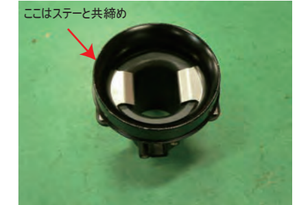
アダプターを乗せてボルト A で取り付けます。