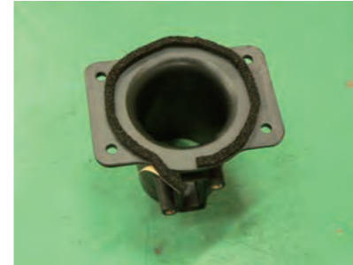
写真を参考に、センサーアダプターにパッキングテープを一周貼り付けます。