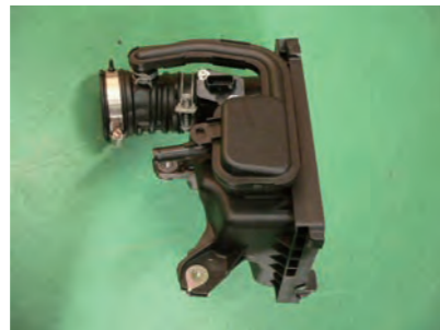
サクシジョンホースごとケースを取り外します。