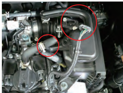
ブローパイホースを抜いてエアフロセンサーのカプラーを外します。