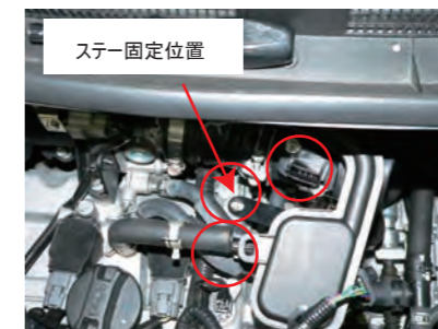
ステアで固定します。ブローパイホース、エアフロセンサーのカプラーを取り付けます。