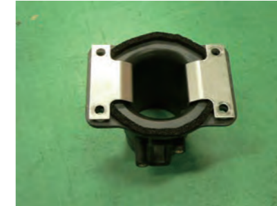
整流フィンを乗せます。