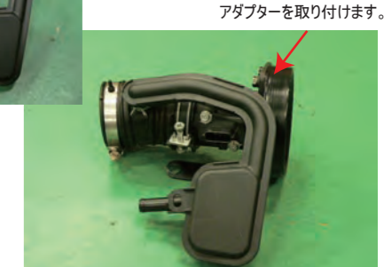
純正のサクシジョンホースにアダプターを取り付けます。