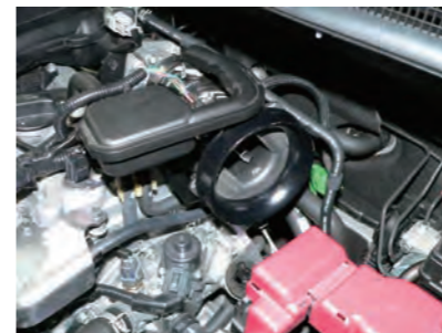
組み立てたサクシジョンホースをスロットルに取り付けます。