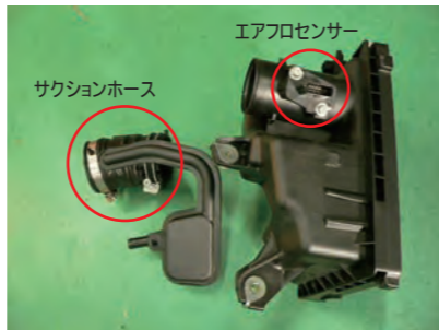
ケースからサクシジョンホース、エアフロセンサーを取り外します。