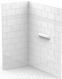
SUP48-2 SUPREME SHOWER WALL MURS DE DOUCHE SUPREME

YOU MAY ALSO LIKE | VOUS POURRIEZ AUSSI AIMER