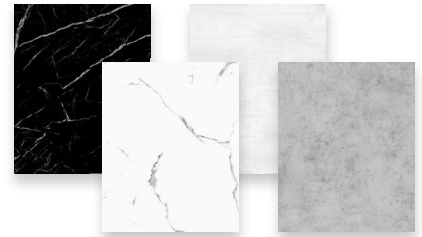
DP4796 SURFACE DESIGN DECORATIVE PANELS PANNEAUX DÉCORATIFS SURFACE DESIGN

MORE PRODUCTS AVAILABLE ON/PLUS DE PRODUITS DISPONIBLES SUR : TECHNOFORM.CA