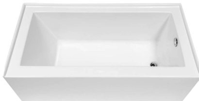
LRH6031/LLH6031 ELARA BATHTUB BAIGNOIRE ELARA