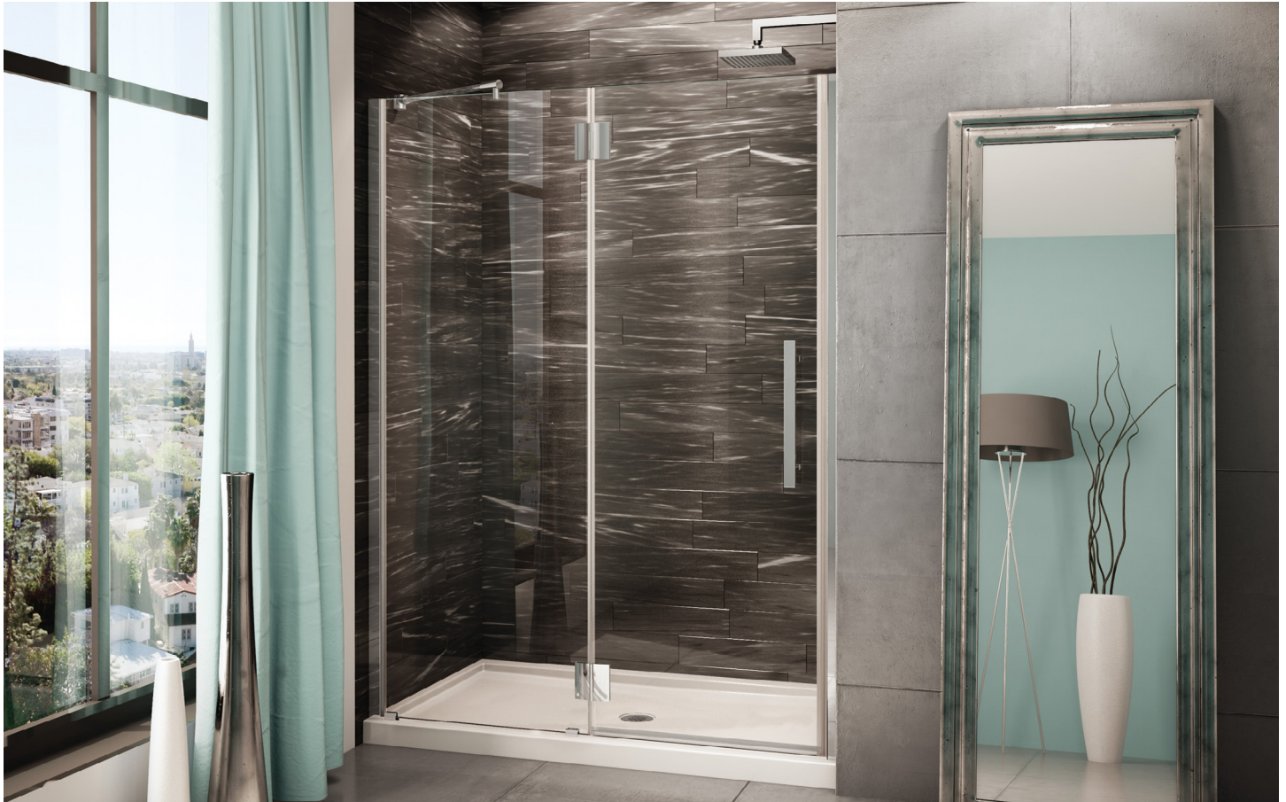
Model shown / Modèle présenté : In-line / En Alcôve (PXLP57-11-40L-TD)