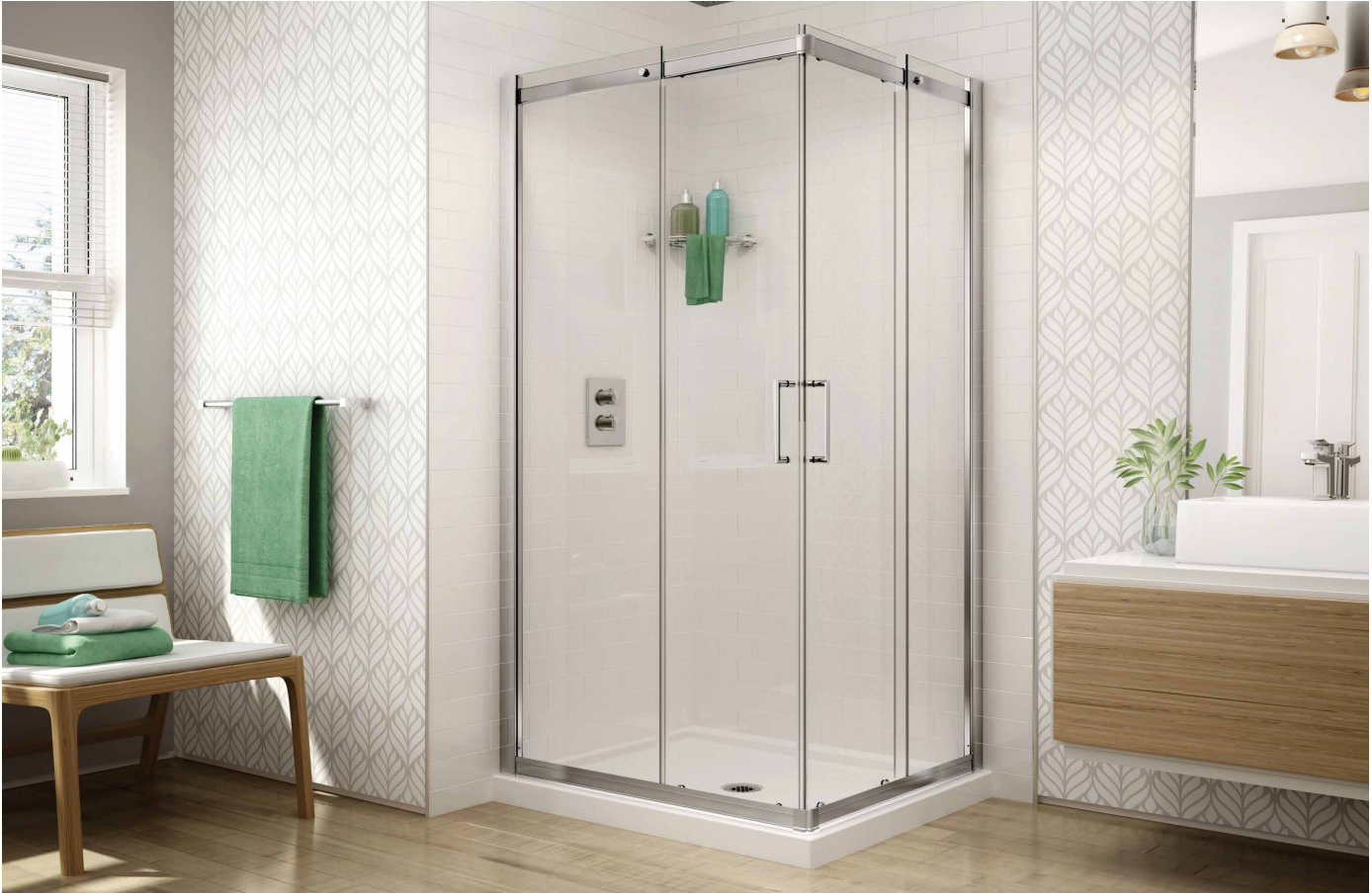
Model shown / Modèle présenté : STC42-11-40

Semi-frameless corner entry sliding doors / Portes coulissantes à entrée en coin avec cadre partiel