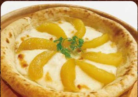
あづまキッチン 福島県産桃とモッツアレラチーズのピザ ~はちみつがけ~