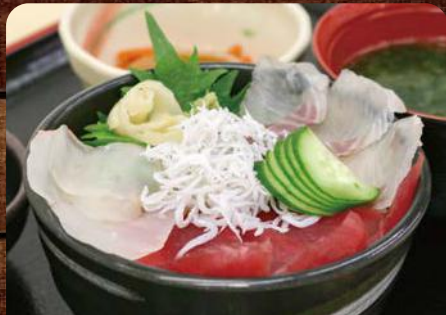
海鮮丼 寿司〇(まる) ふくしま常磐もの海鮮丼