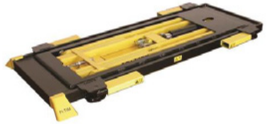
Jollift 1330 Bench 1ROTEL SC19