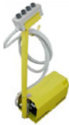
COMBI PH Neumohidráulica