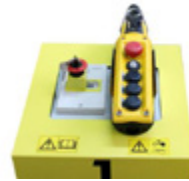
Mando a distancia RC (accesorio opcional)