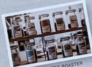
TAISHO COFFEE ROASTER