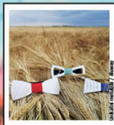
Unikatni mešanici / Alway