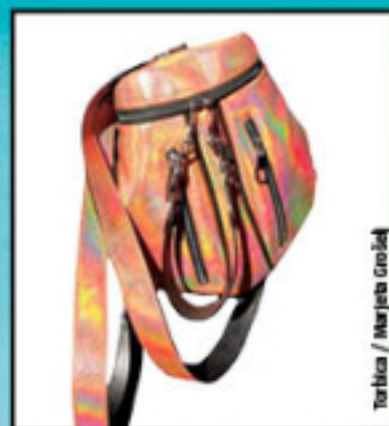
Torbica / Marjeta Grošelj