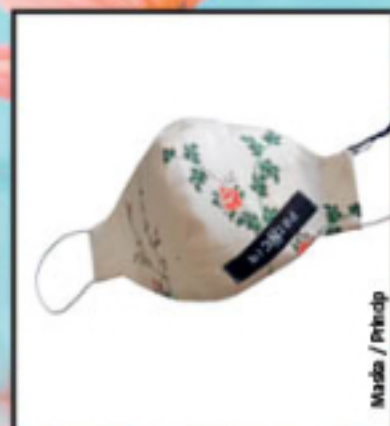
Masla / Priscip