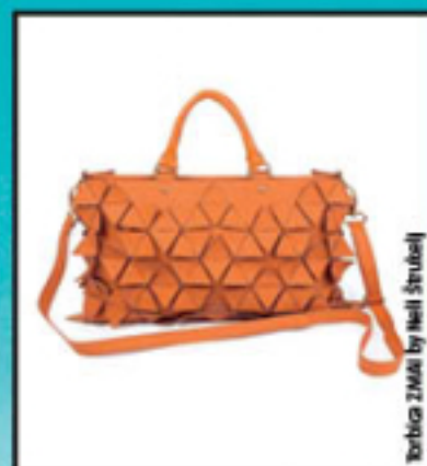
Torbica ZMAI by Neil Strudelj