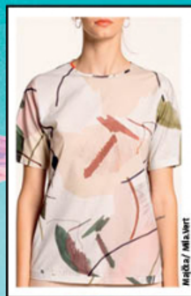
Majica / Milla Vert