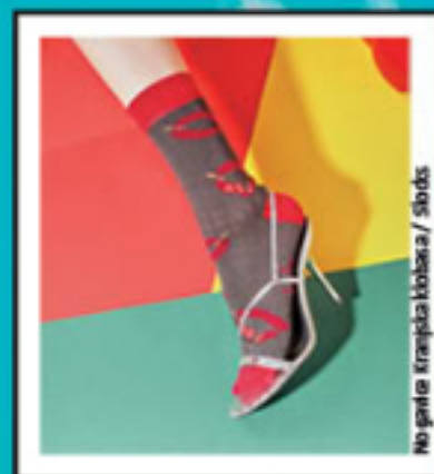
Mo gracie / Kraljica klobasa / Slords