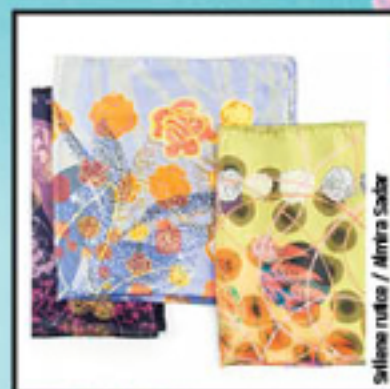
Selene ručice / Alina Sackar