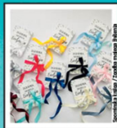
Spominska knjiga / Zgodba mojega življenja