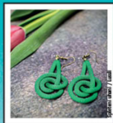
Spiliceni ušani / Urša