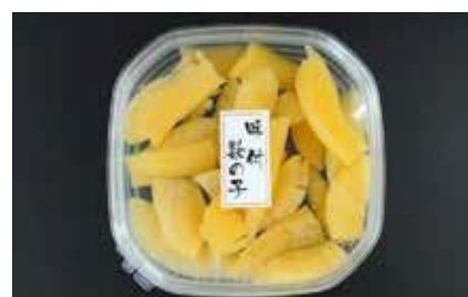
産地/加工地：アメリカ/釧路