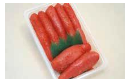
産地/加工地：アメリカ/釧路