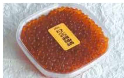
産地/加工地：北海道/釧路