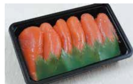
産地/加工地：アメリカ/釧路