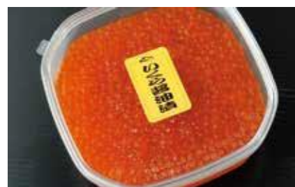
産地/加工地：北海道/釧路