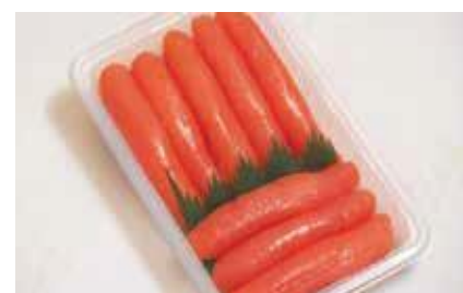
産地/加工地：アメリカ/釧路