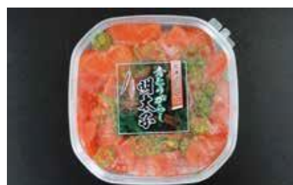
産地/加工地：ロシア/釧路