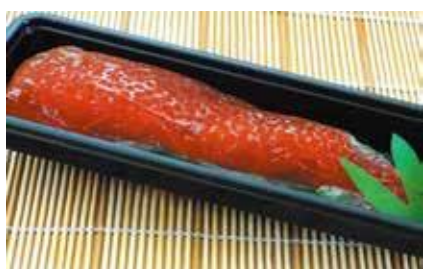
産地/加工地：北海道/釧路