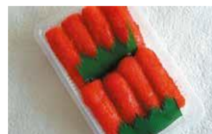
産地/加工地：アメリカ/釧路