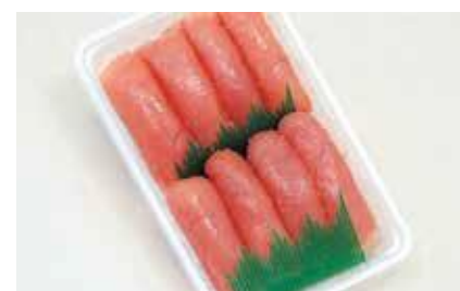
産地/加工地：アメリカ/釧路