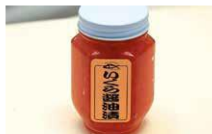
産地/加工地：北海道/釧路