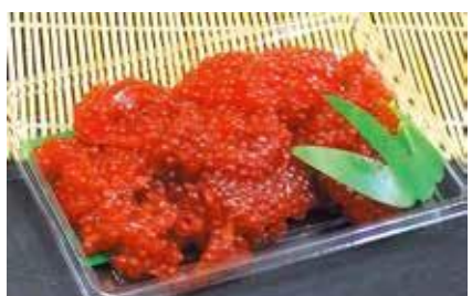
産地/加工地：北海道又はロシア/釧路