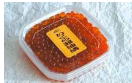
産地/加工地：北海道/釧路