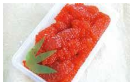
産地/加工地：北海道又はロシア/釧路