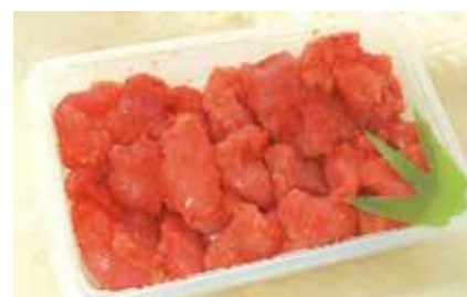
産地/加工地：アメリカ/釧路