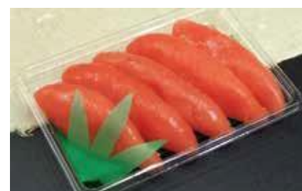
産地/加工地：アメリカ/釧路

上質でなめらかな口あたり・しっとり食感 ※房の大きさにより本数が変更になる場合がございます