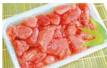
産地/加工地：アメリカ/釧路

上質でなめらかな口あたり・しっとり食感 ※房の大きさにより本数が変更になる場合がございます