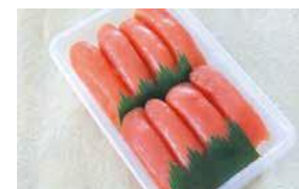
産地/加工地：アメリカ/釧路