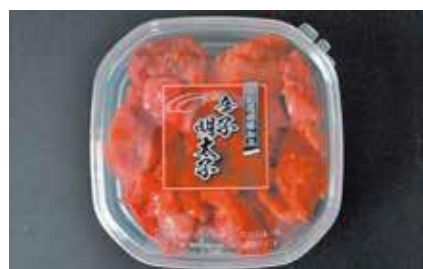
産地/加工地：アメリカ又はロシア/釧路