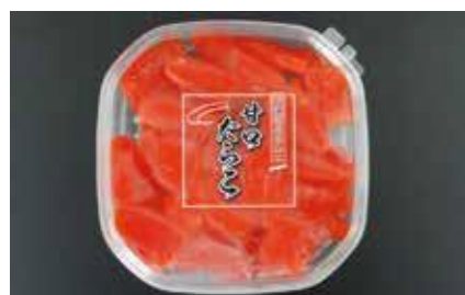
産地/加工地：アメリカ又はロシア/釧路