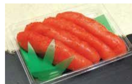
産地/加工地：アメリカ/釧路

大ぶりサイズでマイルドな辛さ ※房の大きさにより本数が変更になる場合がございます