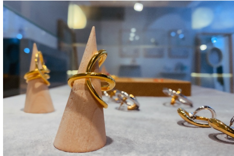
Charlotte CHESNAIS (ジュエリー)