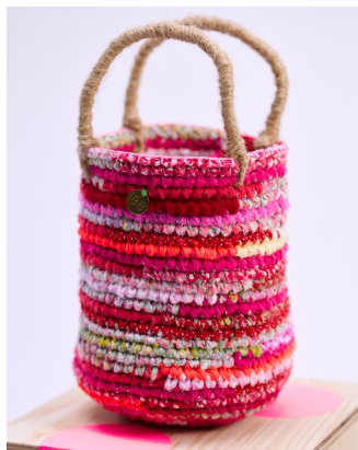
Bud. (ハンドメイドバッグ)