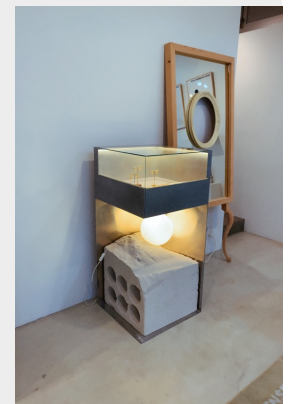
第一弾 シャーロットシェネを開催した時の店内の様子