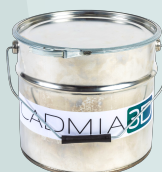
Kbelík 12 l

Součástí balení cadMIXu je i potřebné příslušenství, které vám umožní začít okamžitě pracovat.