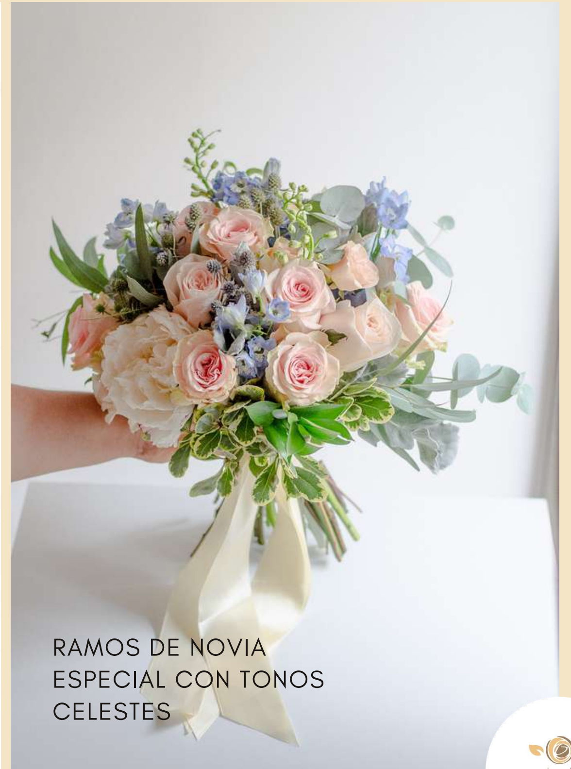
RAMOS DE NOVIA ESPECIAL CON TONOS CELESTES