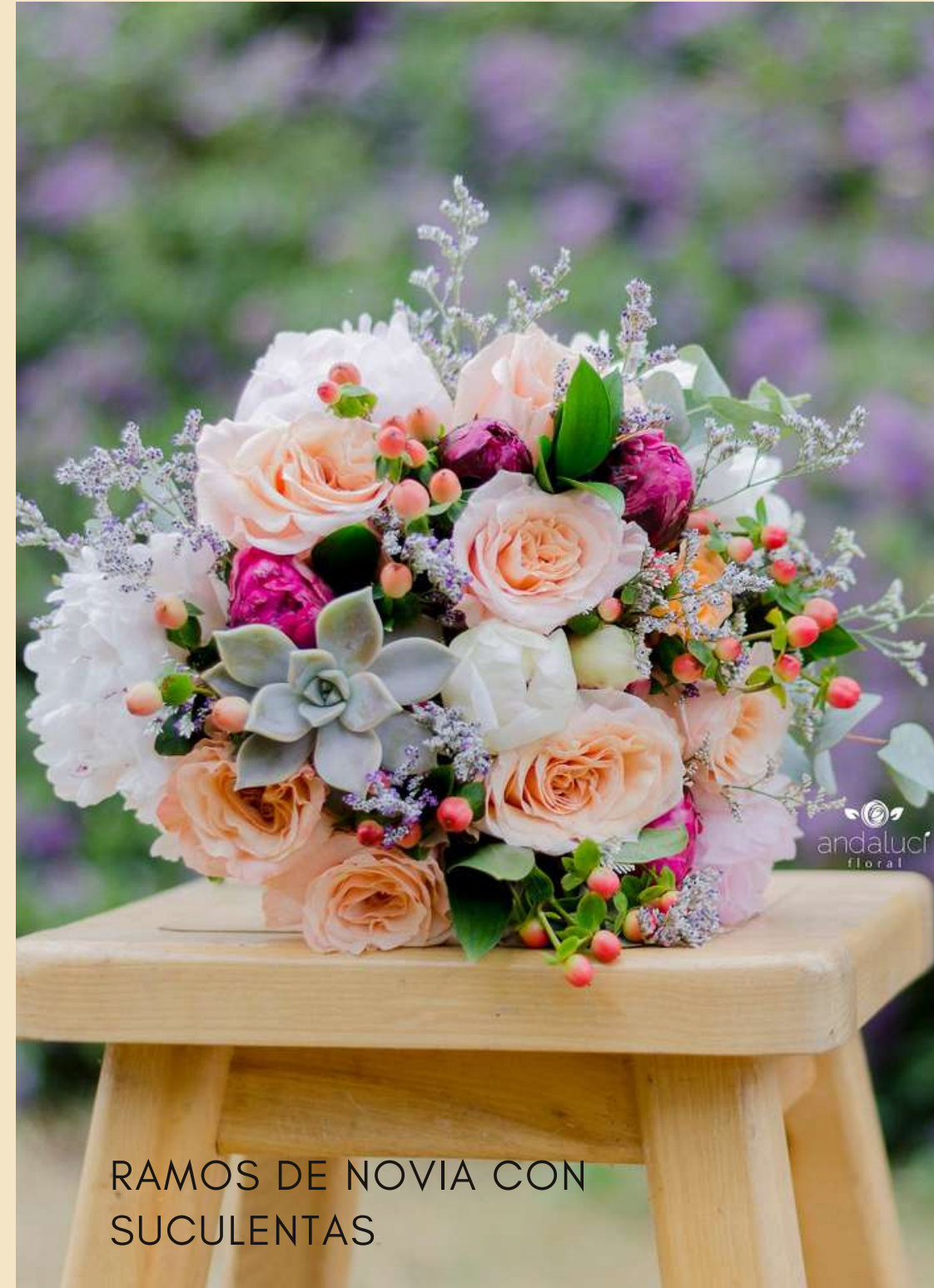
RAMOS DE NOVIA CON SUCULENTAS