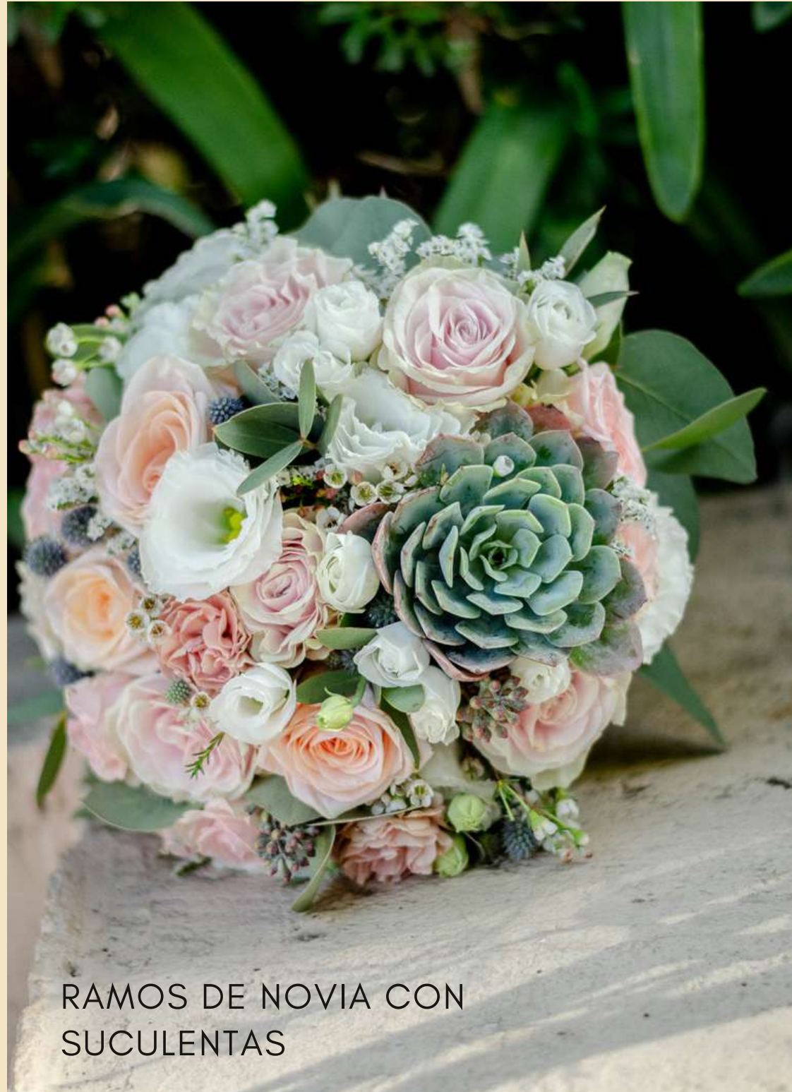
RAMOS DE NOVIA CON SUCULENTAS