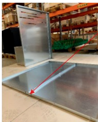
Monteringsplatta – bulthuvud neråt.