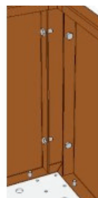
Trinn 1 +2