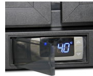
Beskyttende afskærmning af termostat