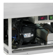
Automatisk fordampning af afrimningsvand