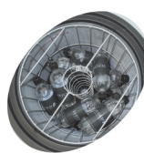
Indvendig ventilator og kurv