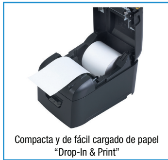
Compacta y de fácil cargado de papel "Drop-In & Print"