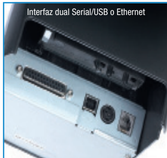
Interfaz dual Serial/USB o Ethernet