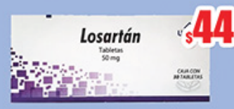
LOSARTAN 50 MG TAB C/30