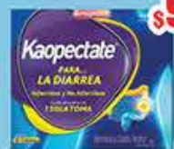
KAOPECTATE ANTIDIARREICO 10 TA