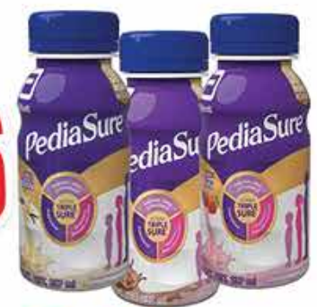
PEDIASURE PLUS VAINILLA, FRESA, CHOCOLATE 237ML