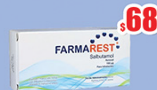
SALBUTAMOL AEROSOL 100 MCG 200 DOSIS