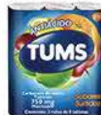
TUMS EXTRA SURTIDO 3 ROLL