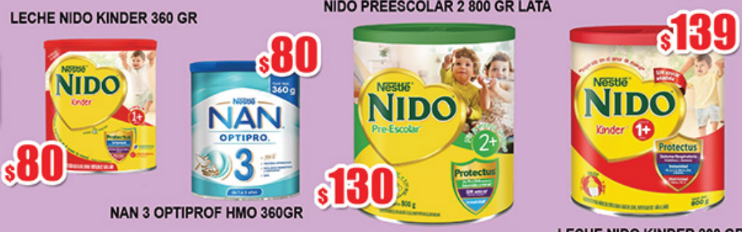
NAN 3 OPTIPRO HMO 360GR