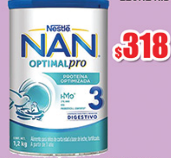
LECHE NAN 3 OPTIMAL PRO 1.2 KG