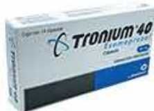
TRONIUM 40 14 CAPS 40MG