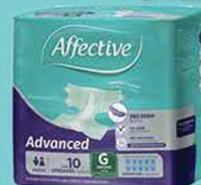
PAN AFFECTIVE ADVANCED GDE 10 PZS