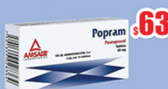
PANTOPRAZOL 40 MG TAB C/14