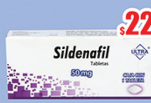
SILDENAFIL 50 MG. TAB C/1