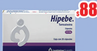
TAMSULOSINA 0.4 MG. CAPS C/20