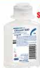
OTROZOL 500MG/100ML SOLUCIÓN INY