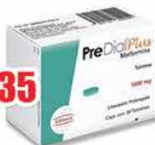
PREDIAL PLUS 30 TABS 1000MG