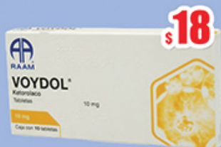
KETOROLACO 10 MG TAB C/10