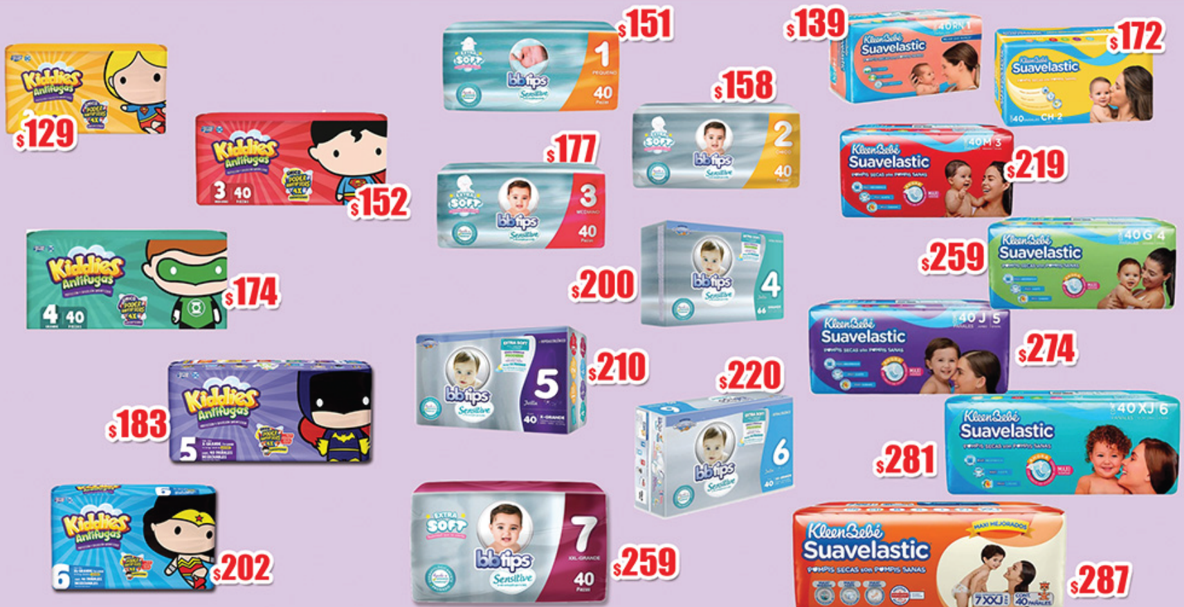
PAN KIDDIES ANTIFUGAS T2, 3, 4, 5 y 6 40 PZS