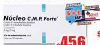
NUCLEO CMP FORTE 30 CAP 5MG/3M