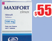
SILDENAFIL 100MG TAB C/1