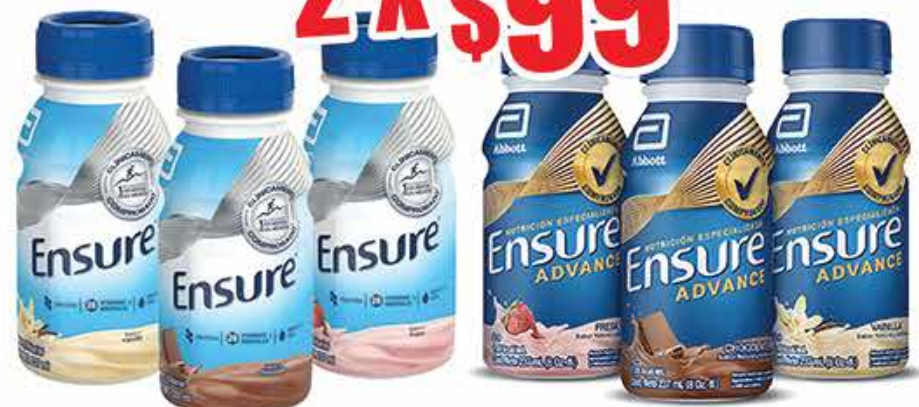
ENSURE REG FRESA, VAINILLA Y CHOCOLATE SINGLES 237ML