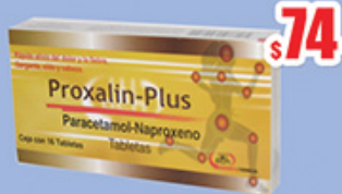
NAPROXENO-PARACETAMOL 300 MG./250 MG. TAB C/16