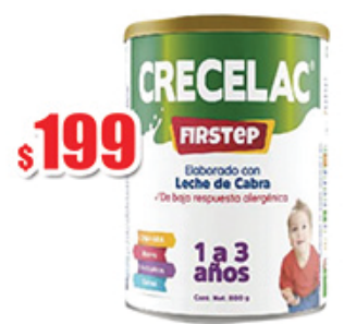
CRECELAC FIRSTSTEP 1-3 ANOS 800GR