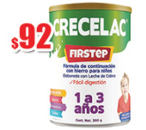
CRECELAC FIRSTSTEP LECHE DE CABRA 360GR