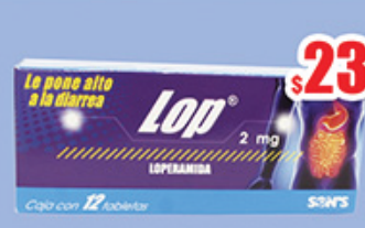
LOPERAMIDA 2 MG TAB C/12