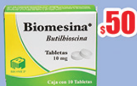
BUTILHIOSCINA 10 MG. GRAGEAS C/10