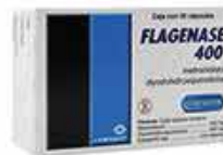
FLAGENASE 400 C/30 CAPS