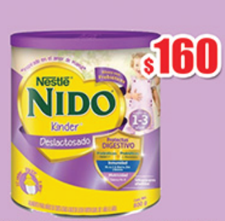
LECHE NIDO KINDER DESLAC 800GR