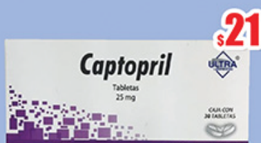
CAPTOPRIL 25 MG. TAB C/30