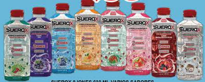
SUEROX 8 IONES 630 ML VARIOS SABORES