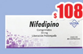
NIFEDIPINO 30 MG TAB C/30