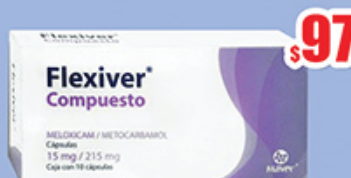
METOCARBAMOL-MELOXICAM 215/15MG CAP C/10