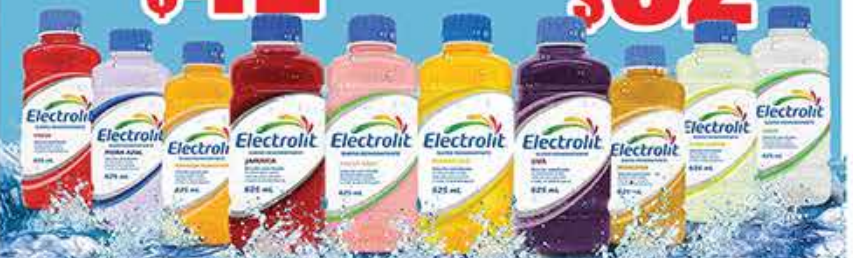
ELECTROLIT 625ML VARIOS SABORES