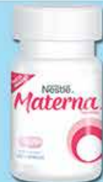
MATERNA 30 TABS