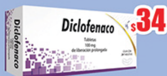
DICLOFENACO 100 MG TAB C/20