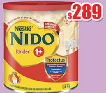
LECHE NIDO KINDER 1 PROTECTUS 1.6KG