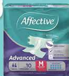
PAN AFFECTIVE ADVANCED MED 10 PZS