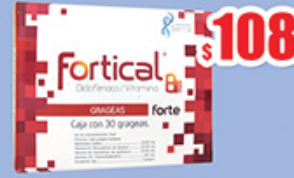
DICLOFENACO-COMPLEJO B GRA C/30