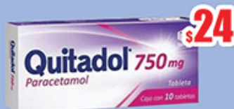
PARACETAMOL 750MG 10TAB