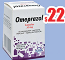
OMEPRAZOL 20 MG. CAPS C/14