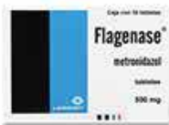
FLAGENASE 30 TABS 500MG