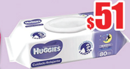
T HUM HUGIES REP RELAJANTE 80 PZ