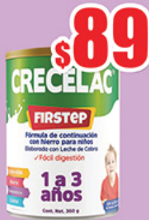
CRECELAC FIRSTSTEP LECHE DE CABRA 360G