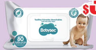
TOA HUM BABYSEC C/80