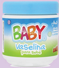
VASELINA BABY AZUL 100 GR