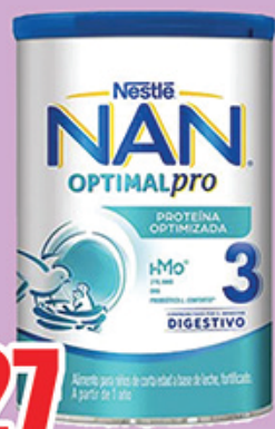
LECHE NAN 3 OPTIMAL PRO 1.2 KG