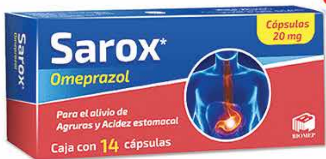
SAROX C/14 CAPS 20 MG