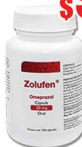
OMEPRAZOL 20 MG. CAPS C/120