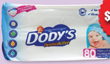
DODY'S AZUL T.H. 80'S