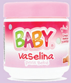
VASELINA BABY ROSA 100 GR