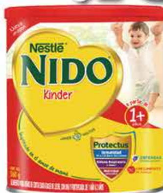
LECHE NIDO KINDER 360 GR