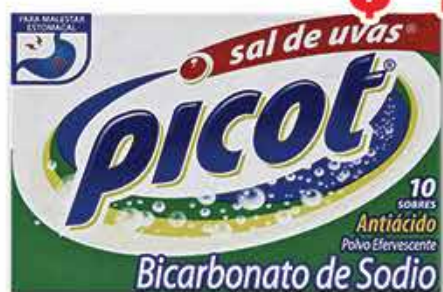
SAL DE UVAS PICOT 10 SOBR