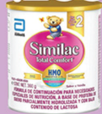
SIMILAC TOTAL COMFORT HMO 2A ETAPA 360G