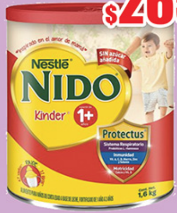
LECHE NIDO KINDER 1 PROTECTUS 1.6KG