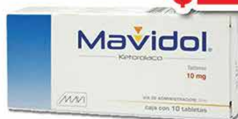
KETOROLACO 10 MG TAB C/10