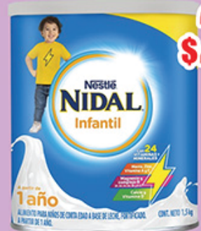
LECHE NIDAL INFANTIL 3 - 1.5 KG