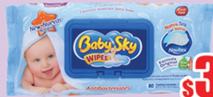
T HUM BABY SKY C/80