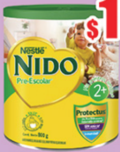
NIDO PREESCOLAR 2 800 GR LATA