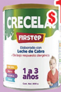
CRECELAC FIRSTSTEP 1-3 AÑOS 800GR