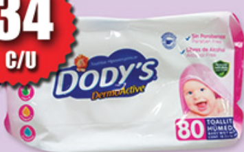
DODY'S ROSA T.H. 80'S