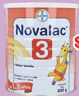
NOVALAC 3 800GR