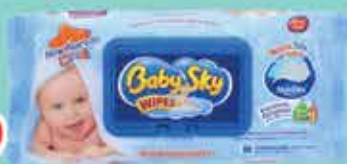
T HUM BABY SKY C/80