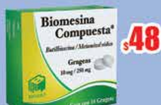
BUTILHIOSCINA 10 MG. GRAGEAS C/10