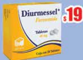
FUROSEMIDA 40 MG. TAB C/20