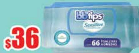
T HUM BB TIPS REFILL 66 PZS