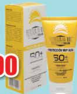
FOTOSUN UV 100 FPS 50 + CREMA 60 ML