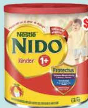
LECHE NIDO KINDER 1 PROTECTUS 1.6KG