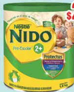
LECHE NIDO 2 PRESCOLAR 1,5