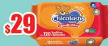
T HUM CHICOLASTIC REFILL 120 PZS