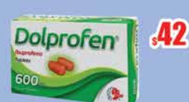
IBUPROFENO 600 MG TAB C/10