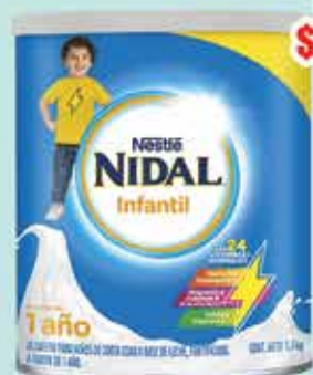
LECHE NIDAL INFANTIL 3 - 1.5 KG