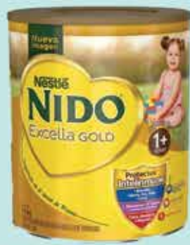
LECHE NIDO EXCELLA GOLD 1.6 KG