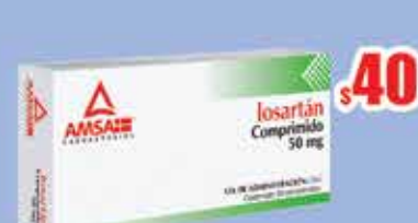
LOSARTAN 50 MG COMP C/30