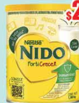
LECHE NIDO FORTICRECE 1.8 KG