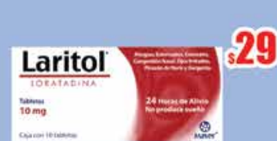
LORATADINA 10MG TAB C/10