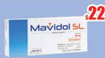
KETOROLACO 30MG SUBLING TAB C/4