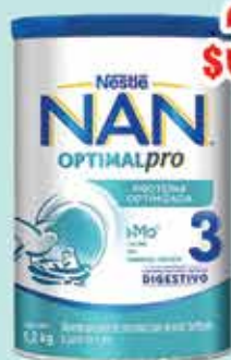
LECHE NAN 3 OPTIMAL PRO 1.2 KG