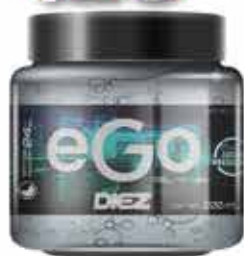
GEL EGO DIEZ 200GR