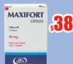
SILDENAFIL 50MG TAB C/1