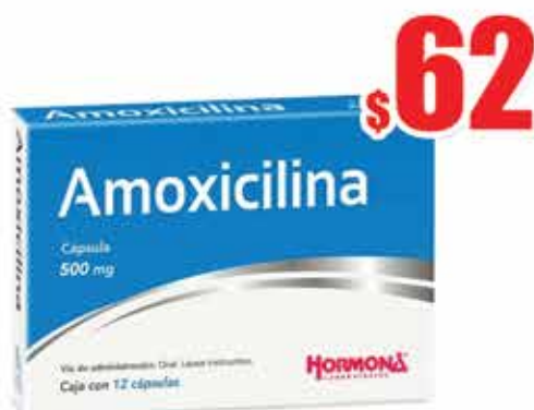
AMOXICILINA 500 MG. CAPS C/12