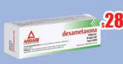
DEXAMETASONA 8 MG AMP C/1