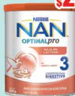
LECHE NAN3 BAJA EN LACTOSA 800