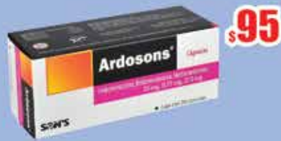
INDOMETACINA-BETAMETAZONA-METOCARBAMOL 25/0.75/215MG CAP C/20