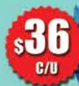
DODY'S AZUL Y ROSA T.H. 80'S