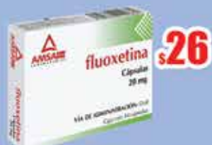
FLUOXETINA 20 MG. CAPS C/14