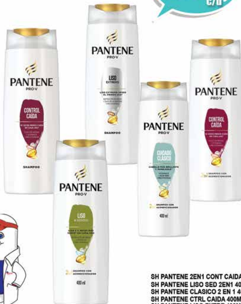
SH PANTENE 2EN1 CONT CAIDA 400 SH PANTENE LISO SED 2EN1 400ML SH PANTENE CLASICO 2 EN 1 400ML SH PANTENE CTRL CAIDA 400ML SH PANTENE LISO EXTRE 400ML