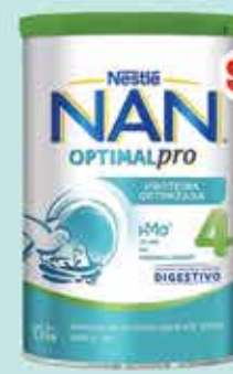
LECHE NAN 4 1.2 KG