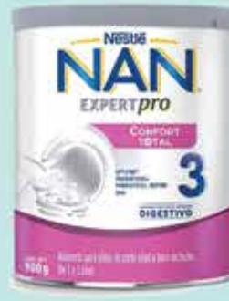
LECHE NAN CONFORT TOT ETP3 900GR