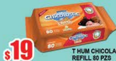
T HUM CHICOLASTIC REFILL 80 PZS