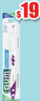
CEP ORA CLEAN MED SENCILLO