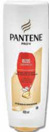
ACOND PANTENE RIZOS DEFI 400ML