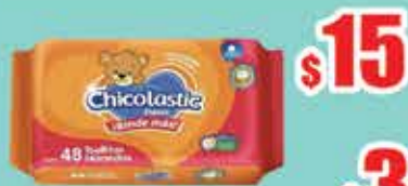
T HUM CHICOLASTIC VIAJERO 48 PZS