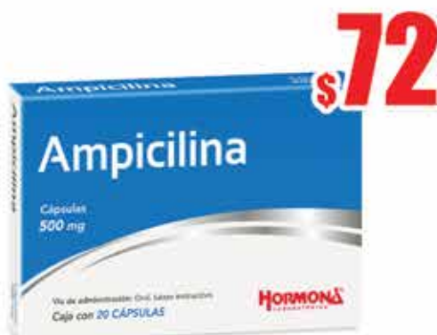
AMPICILINA 500 MG. CAPS C/20