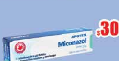
MICONAZOL 1% CRA 20GR