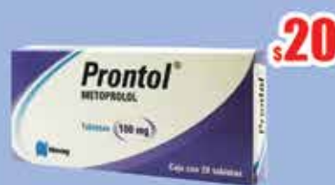
METOPROLOL 100 MG. TAB C/20