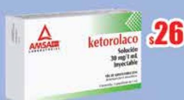
KETOROLACO 30 MG AMP C/3