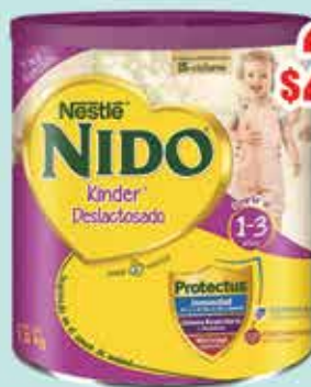
LECHE NIDO KINDER DESLACTOSADA 1.5 GR