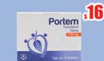
PARACETAMOL 750MG TAB C/10