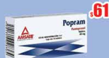
PANTOPRAZOL 40 MG TAB C/14