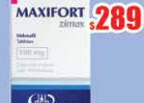
SILDENAFIL 100 MG. TAB C/10