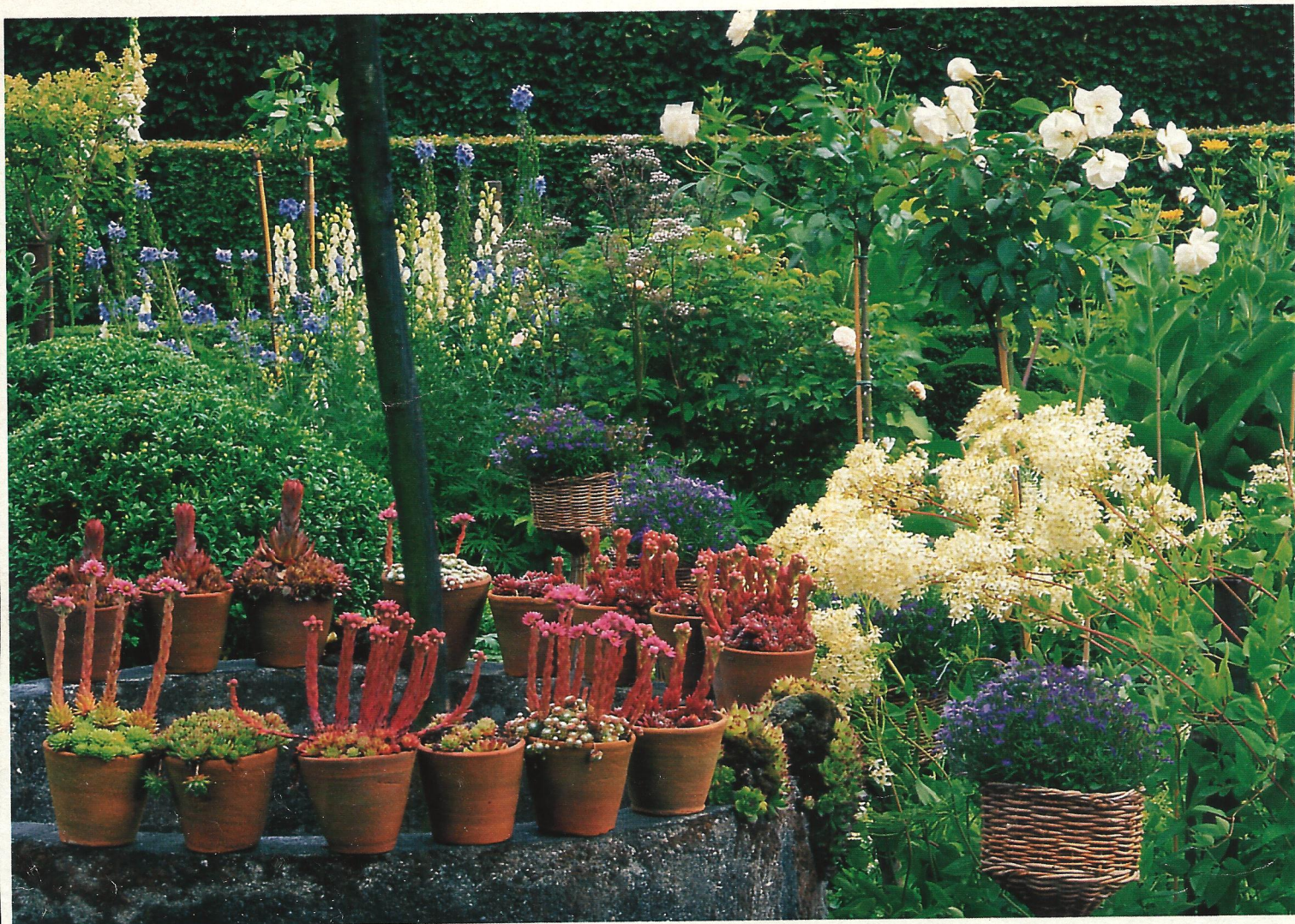
Sur le vieux puits, (ci-dessus) les Aenium sempervirum en fleur, clématites, aconits, delphiniums et digitales. Une collection de vieux brocs (ci-contre). La porte en charmes (à droite) mène au jardin potager traditionnel. RÉALISATION MARIE-FRANCE BOYER