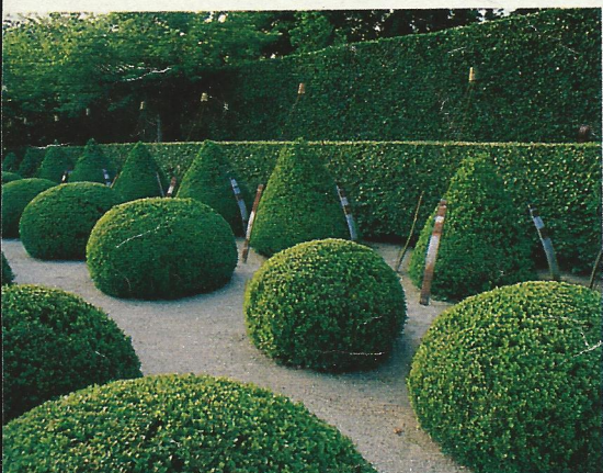
Delphiniums, digitales et rosiers sur tige iceberg (en haut). Le jardin des topiaires (ci-dessus et ci-contre), avec l'installation du sculpteur Camiel Van Breedam.