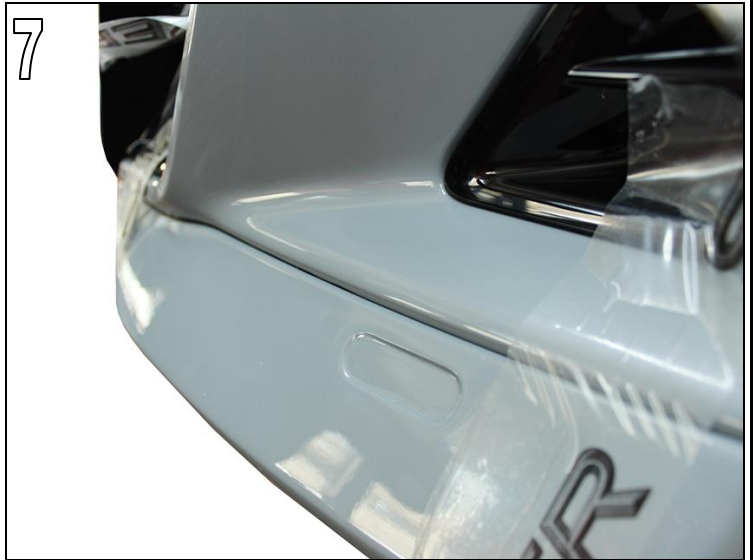
Fig. 7 & 8

Ensure that the AC Schnitzer front spoiler elements are bonded approx. 2-3mm below the contour of the standard front skirt.