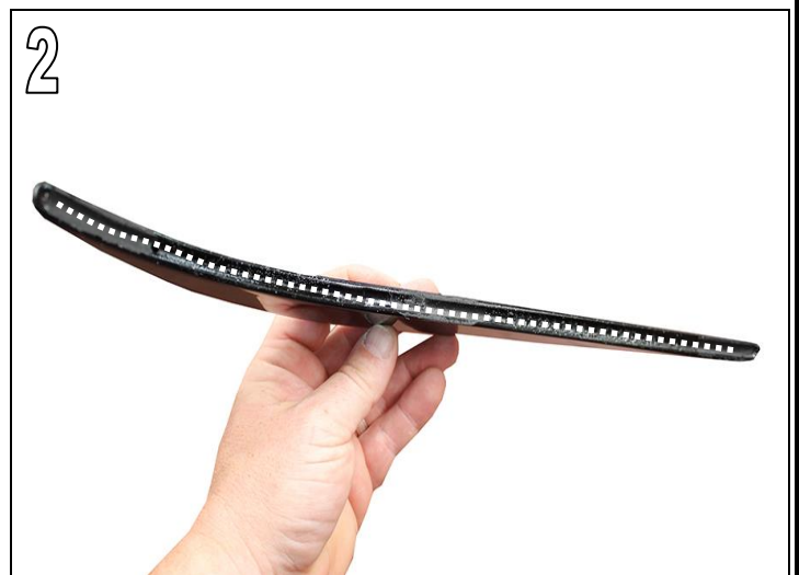
Fig. 2 & 3

Remove paint and primer residues from all gluing grooves on the AC Schnitzer Rear Side Wing. Remove paint and primer residues, sand and clean with the cleaner supplied.