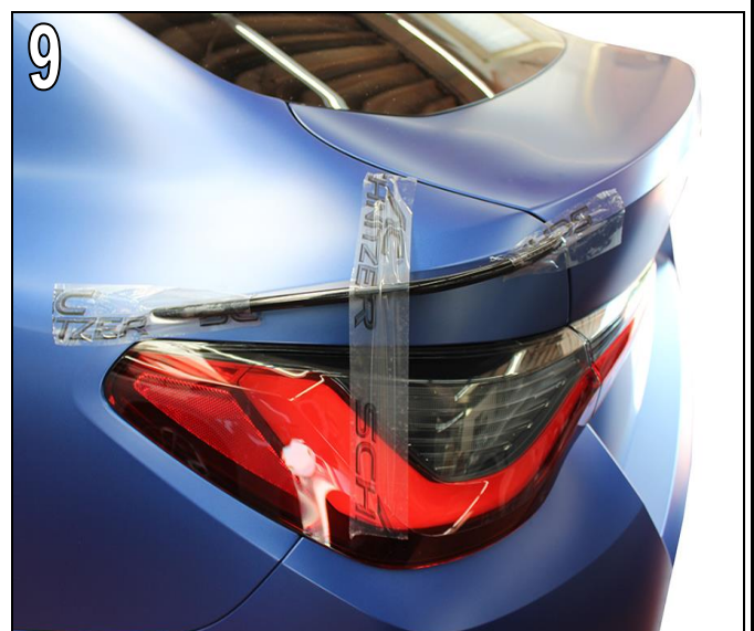
Fig. 9 & 10

Fix the AC Schnitzer Rear Side Wing with adhesive tape.