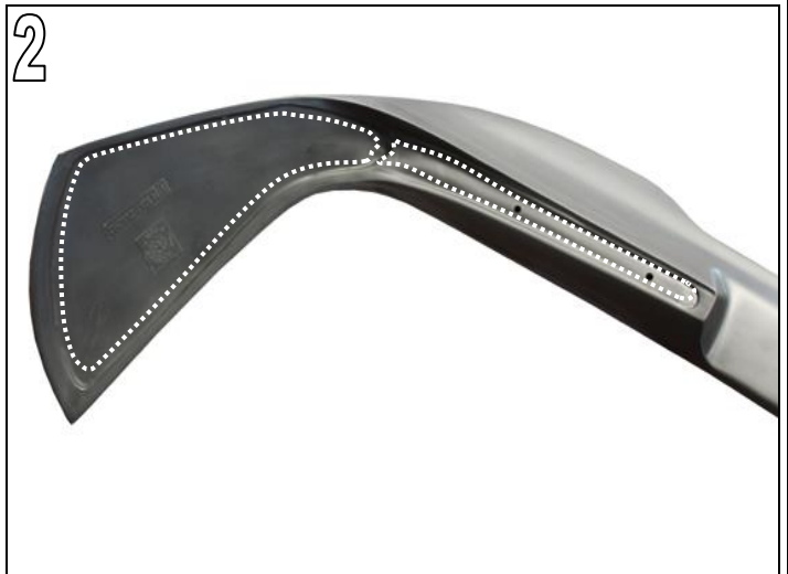
Abb. 1 bis 3

Klebenut / Klebefläche (1) des AC Schnitzer Dachheckflügels von Lack- und Grundierungsresten befreien, anschleifen und mit dem mitgelieferten Reiniger säubern.