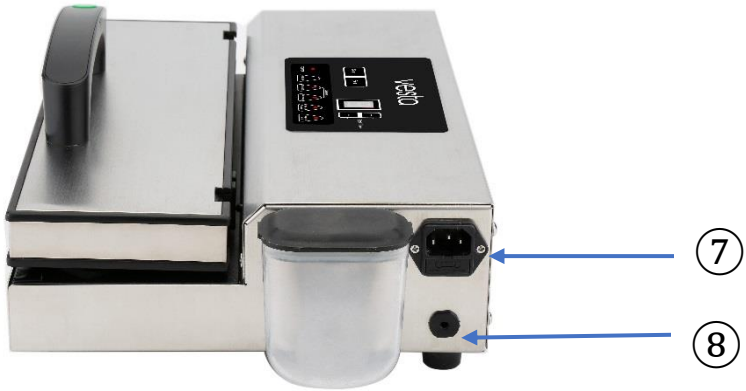
7. Prise du cordon d'alimentation 8. Prise du tube