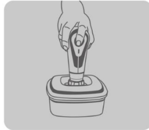
Contenant sous vide