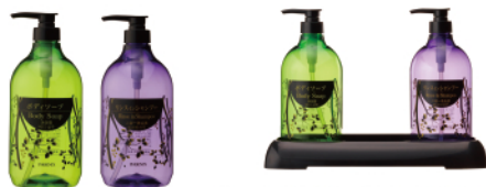
リーフ 1000mL 詰替容器とトレイ