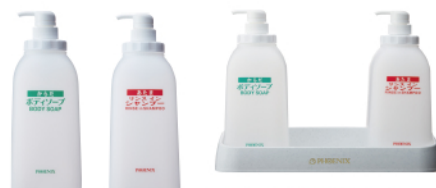
1200mL 詰替容器とトレイ