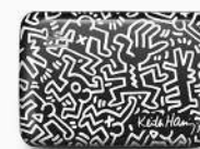
Keith Haring white