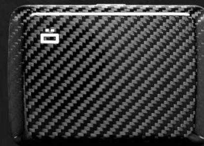
V2 fibre de carbone

Après avoir créé le premier portefeuille en aluminium, ÖGON innove encore en créant une version luxueuse du V2 et du V2 Large en véritable fibre de carbone.