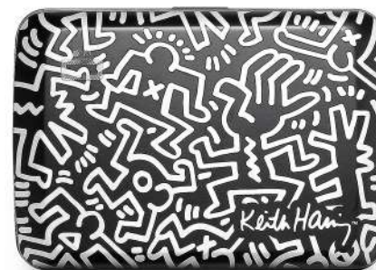
Smart Case V2 & V2L

Keith Haring (1958-90) est l'un des jeunes artistes, cinéastes et performeurs les plus renommés dont l'œuvre fait écho à la culture urbaine des années 1980. Inspiré par les graffitis qui recouvraient les wagons de métro de la ville, Haring a commencé à dessiner à la craie blanche sur le papier noir utilisé pour recouvrir les panneaux publicitaires vacants.