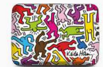
Keith Haring color