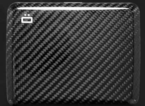
V2 Large fibre de carbone