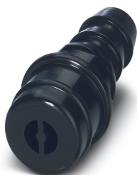
Macho para neumática, para módulo HC-M-PN2, diámetro interior de tubo flexible 6,0 mm

Tenga en cuenta que los datos indicados aquí proceden del catálogo en línea. Los datos completos se encuentran en la documentación del usuario. Son válidas las condiciones generales de uso de las descargas por Internet. ( http://phoenixcontact.es/download )