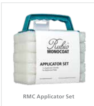
RMC Applicator Set