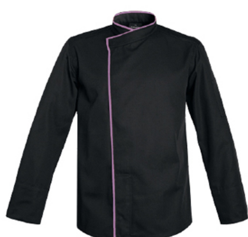
MURANO P.14 / TOKYO P.41