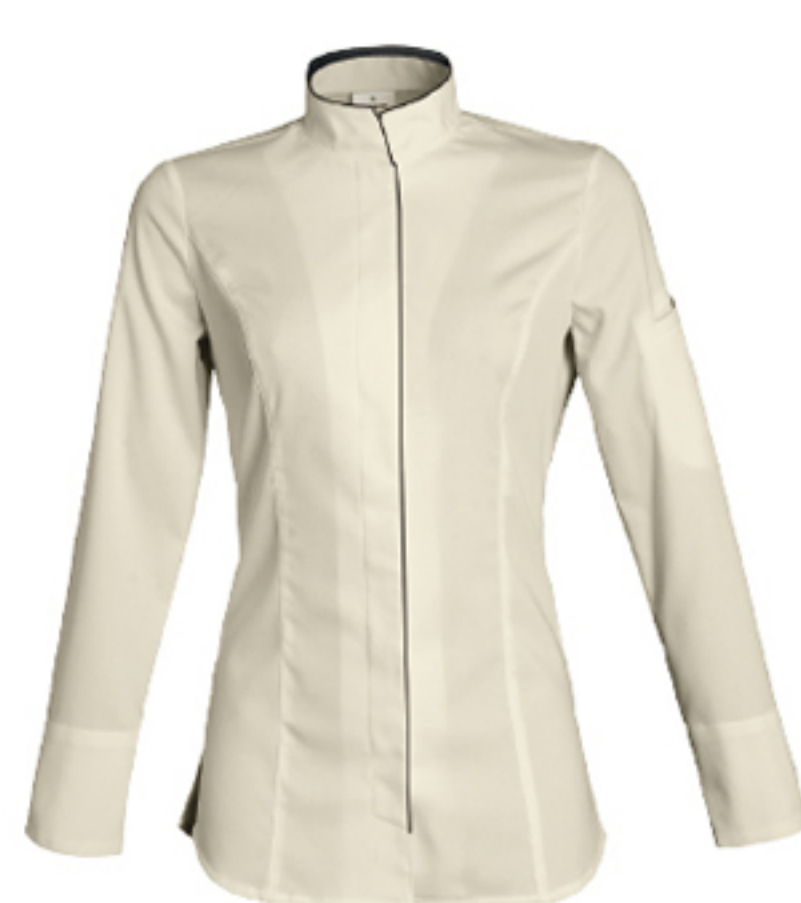
VALENCIA P.61 FUTURE / ALBA P.105