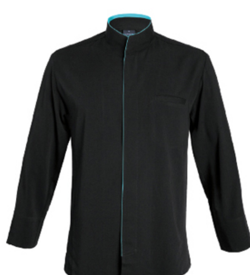
ALICANTE P.24 FUSION / CATANE P.105