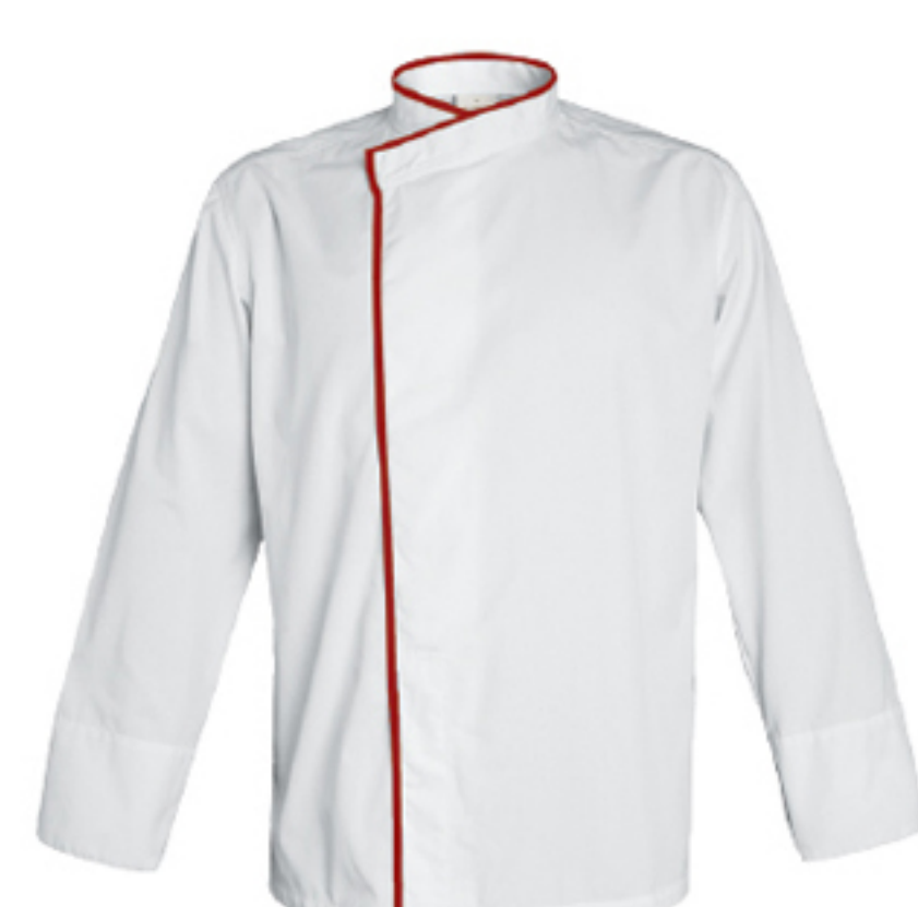
MADISON P.13 / TOKYO P.41