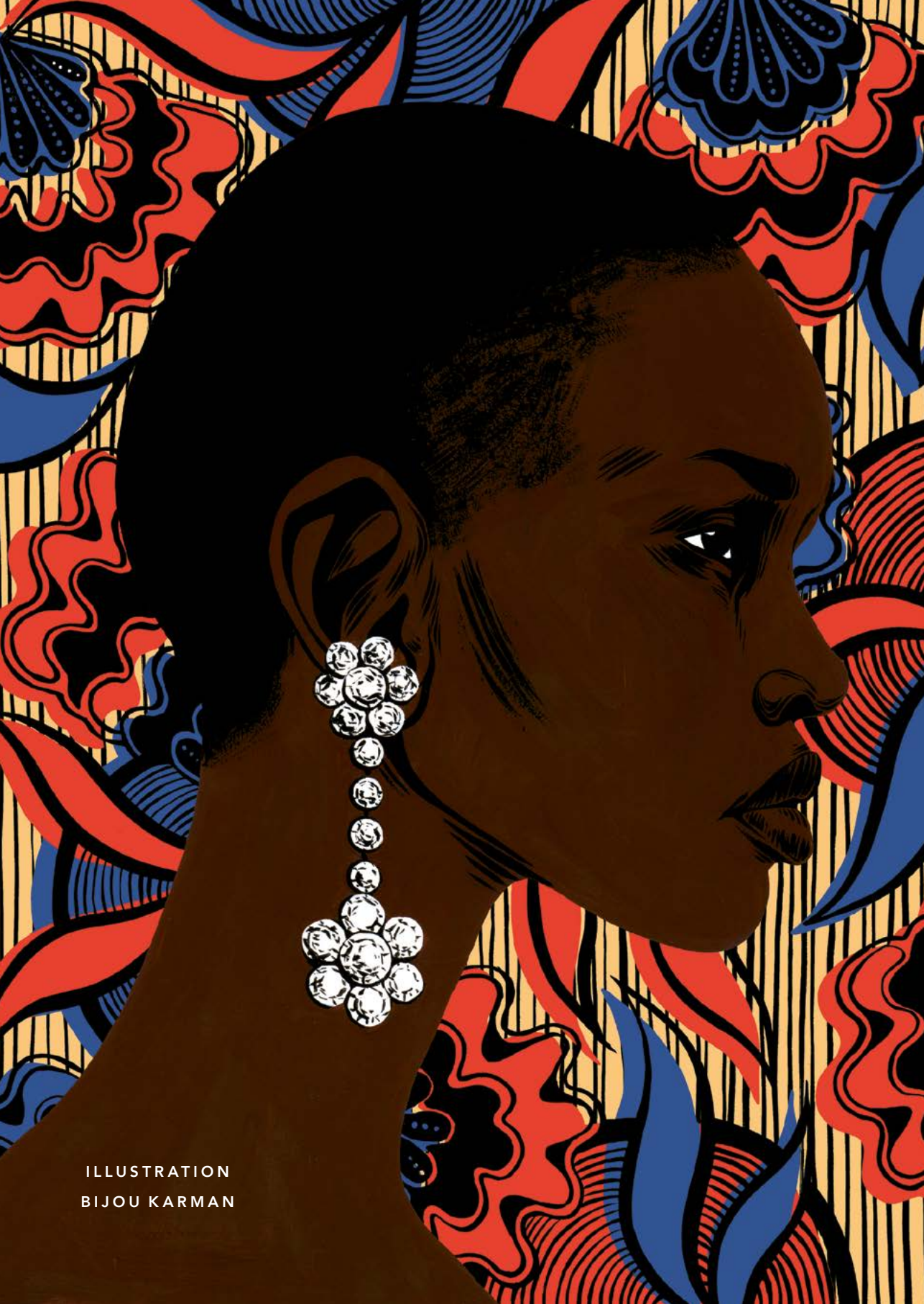
ILLUSTRATION BIJOU KARMAN