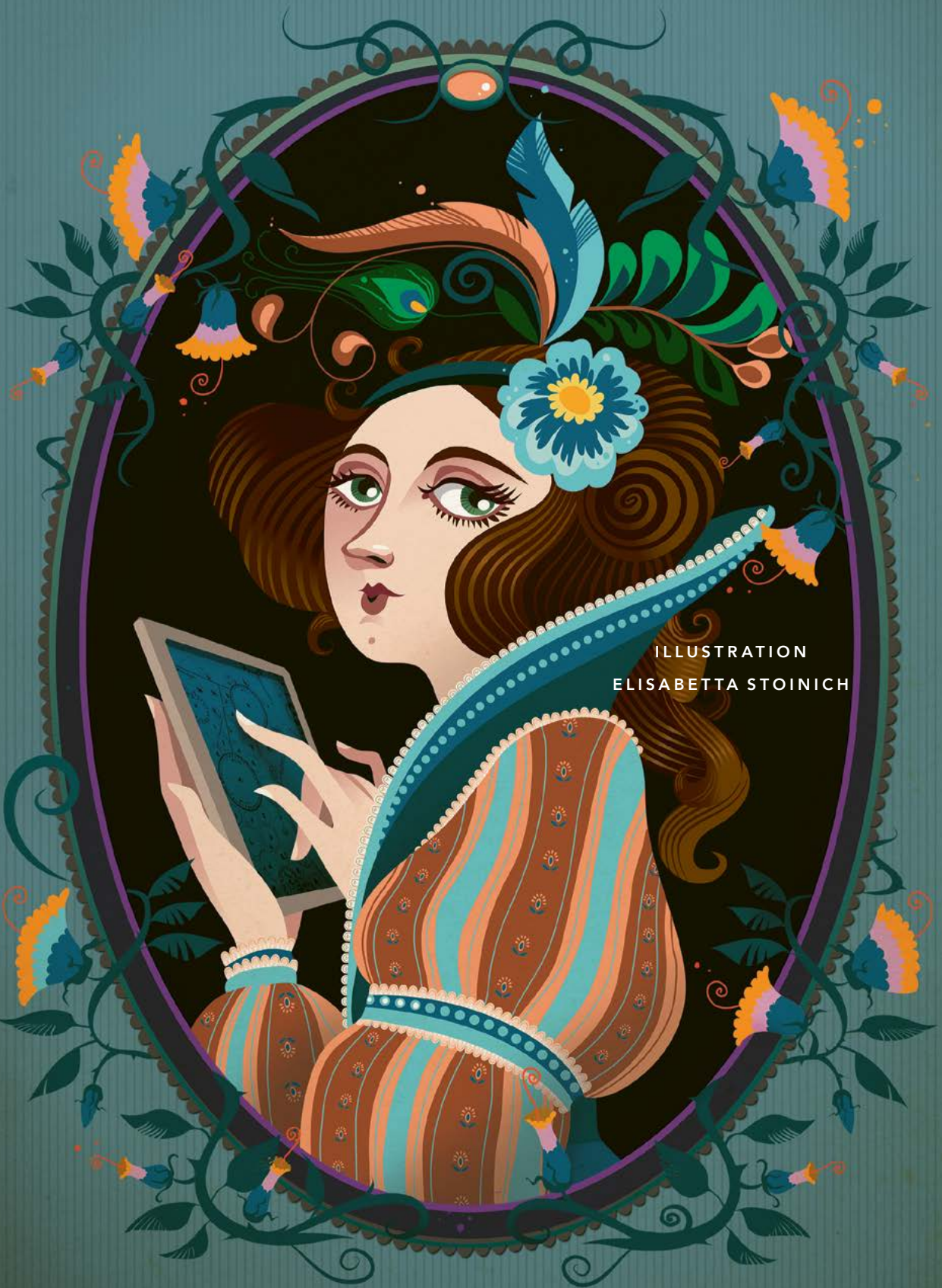
ILLUSTRATION ELISABETTA STONICH