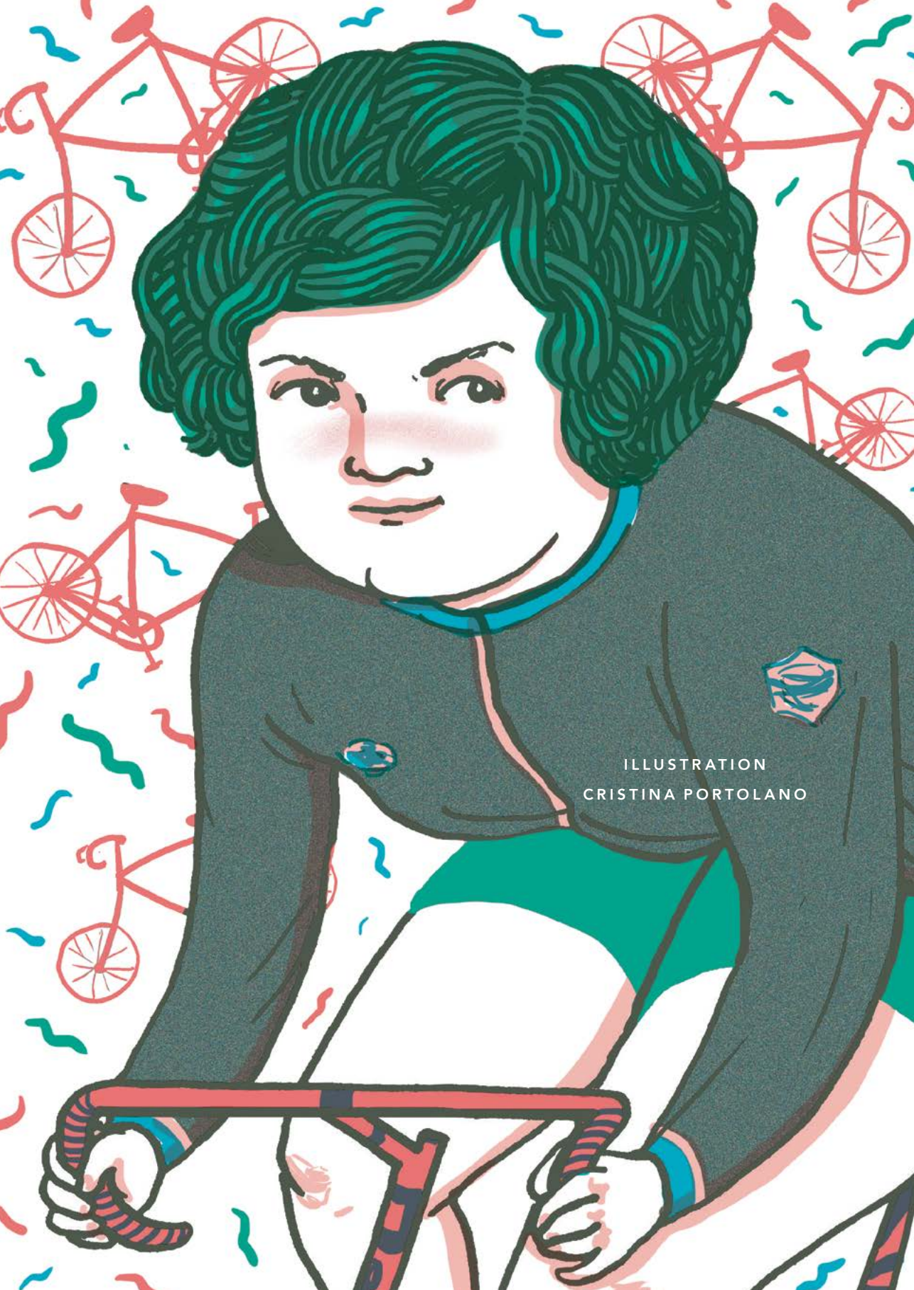
ILLUSTRATION CRISTINA PORTOLANO