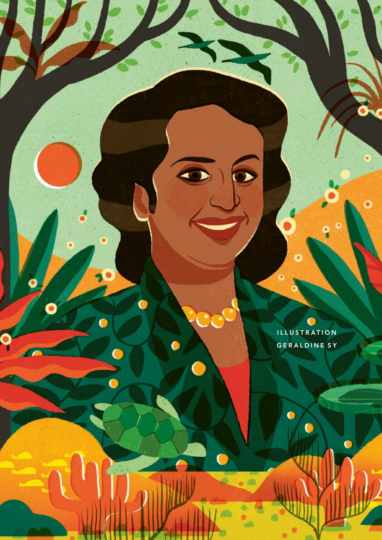
ILLUSTRATION GERALDINE SY