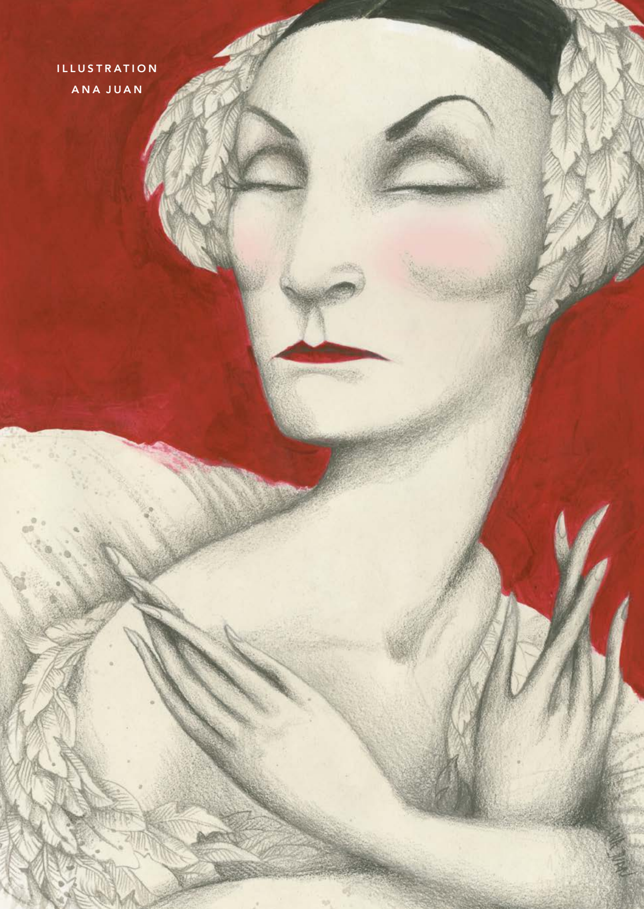
ILLUSTRATION ANA JUAN