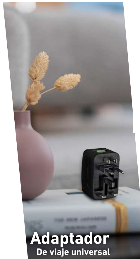
Adaptador De viaje universal