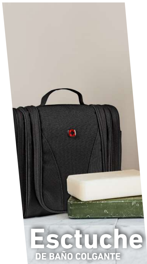
Escuche DE BAÑO COLGANTE