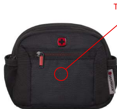
ACCESORIOS DE VIAJE