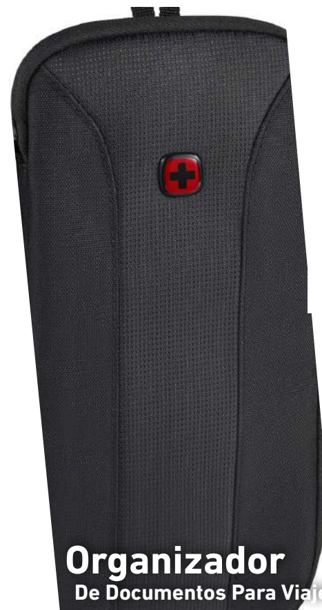
Organizador De Documentos Para Viaje