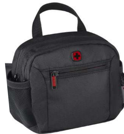
Cangurera De Viaje