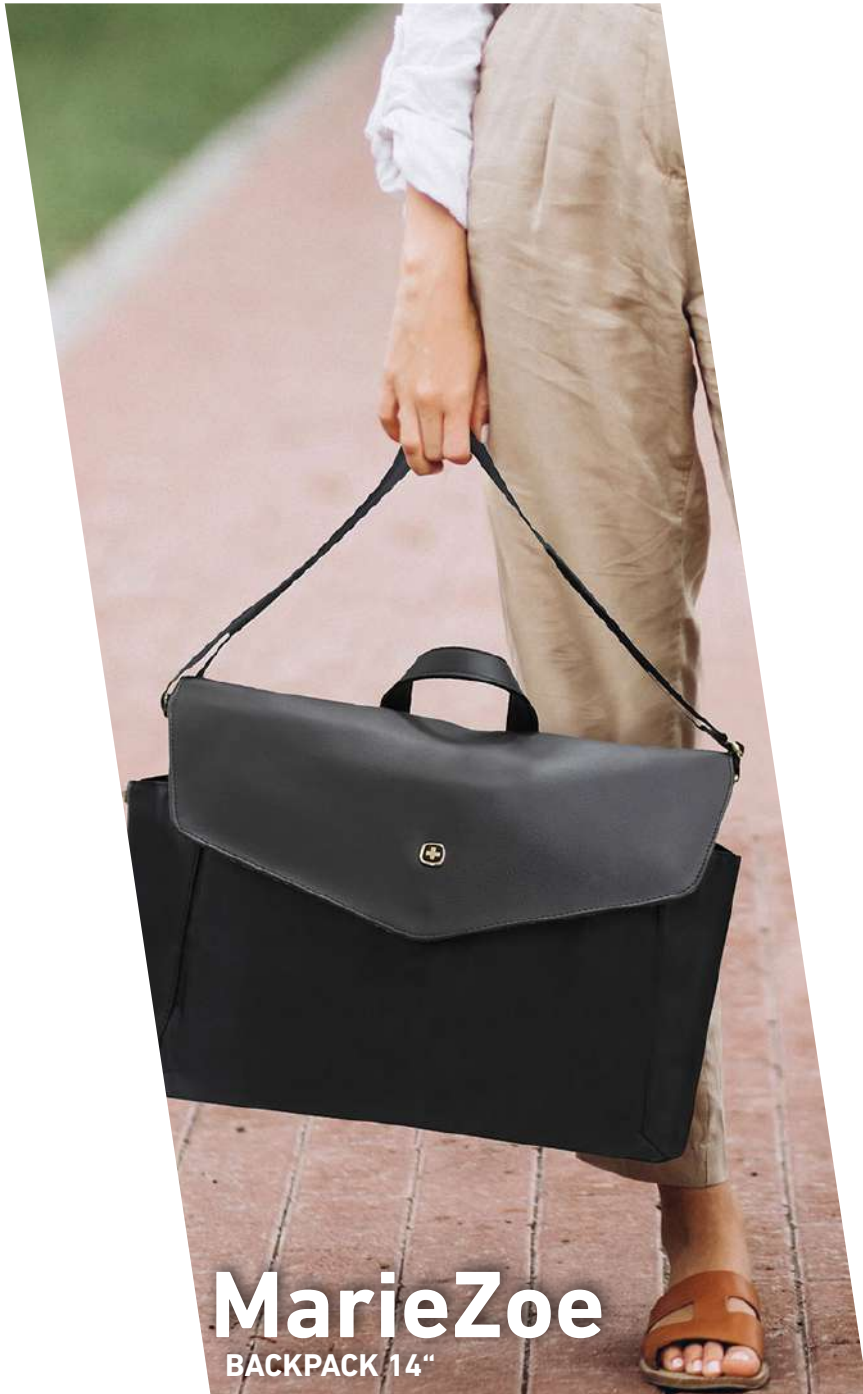
MarieZoe BACKPACK 14"