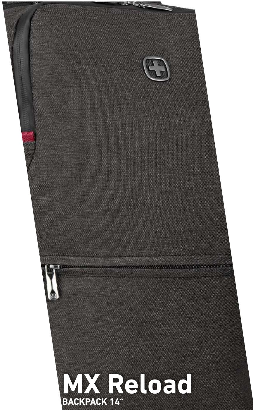
MX Reload BACKPACK 14"