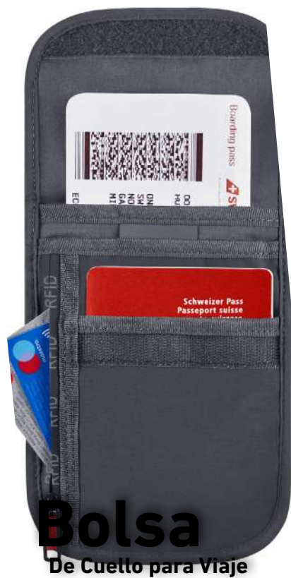
Bolsa De Cuello para Viaje