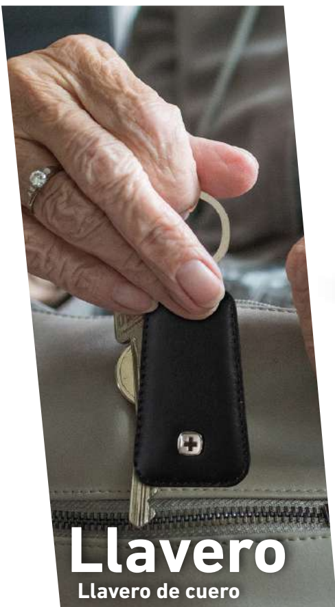
Llavero Llavero de cuero