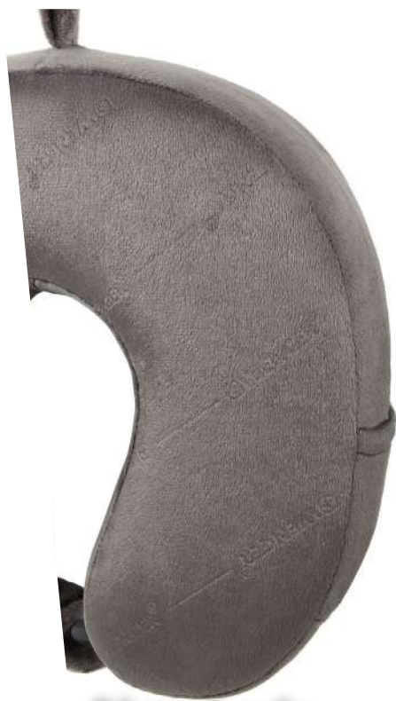
Almohada De Viaje Memory Foam