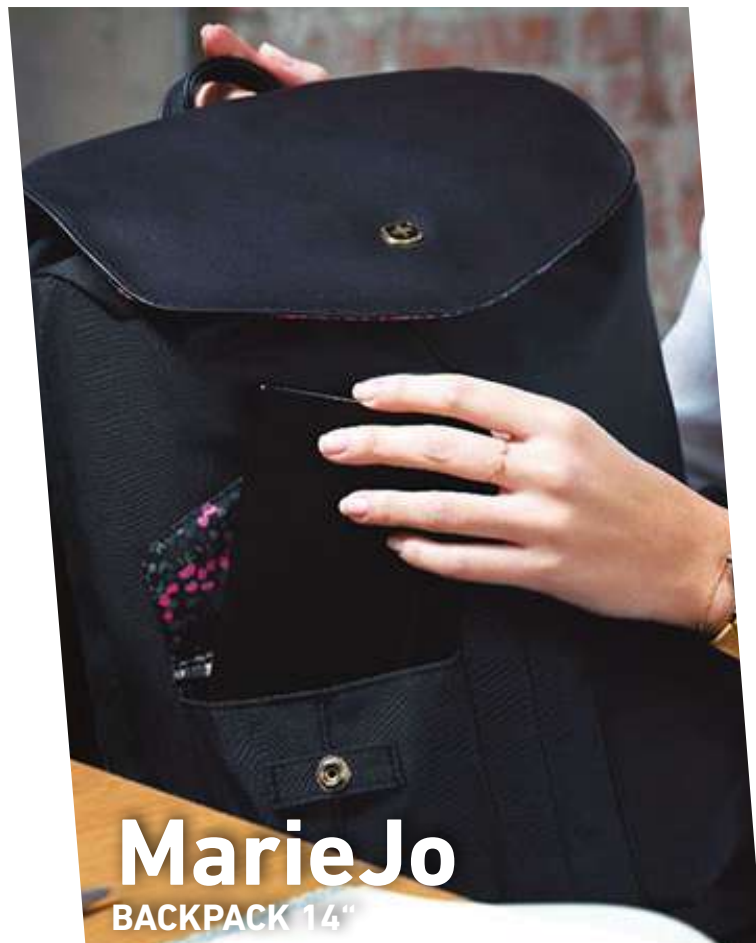
MarieJo BACKPACK 14"