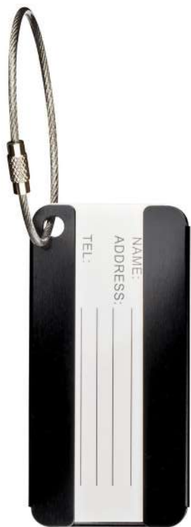
Tag de Aluminio Identificador de equipaje