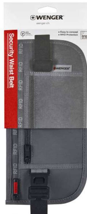
Cangurera De seguridad