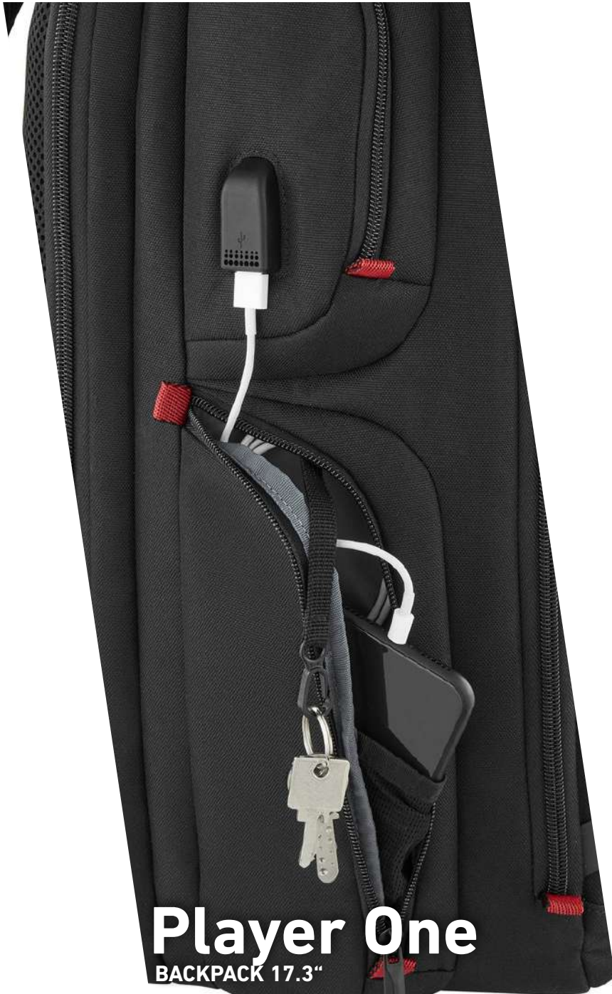
Player One BACKPACK 17.3"