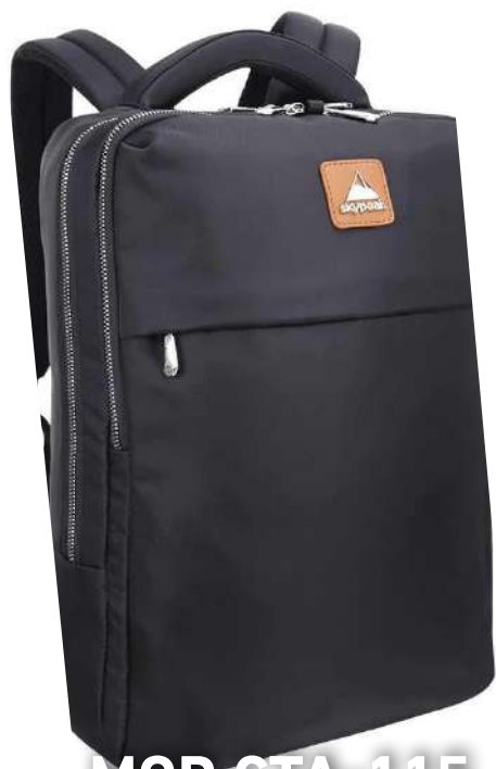
MOD CTA-115 BACKPACK 15.6"