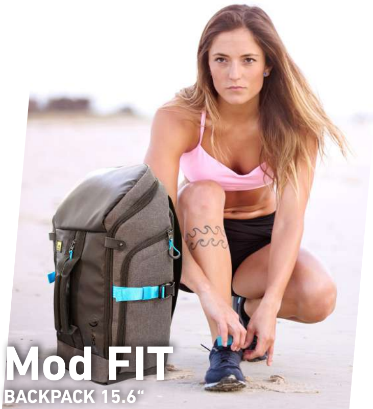
Mod FIT BACKPACK 15.6"