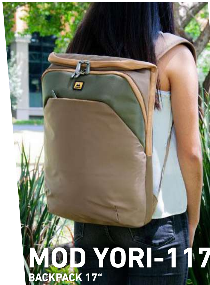
MOD YORI-117 BACKPACK 17"