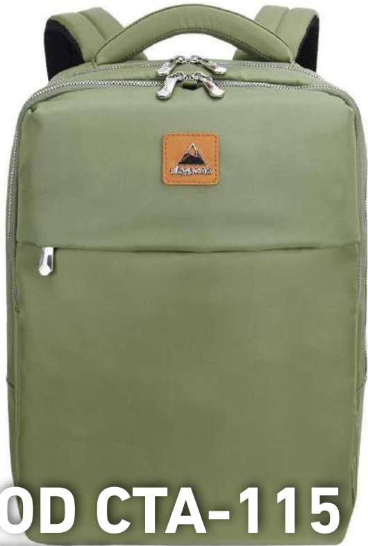
MOD CTA-115 BACKPACK 15.6"