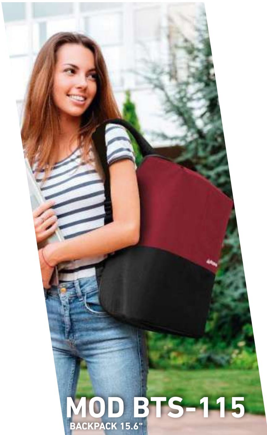
MOD BTS-115 BACKPACK 15.6"