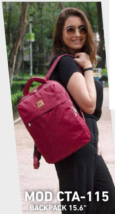
MOD CTA-115 BACKPACK 15.6"