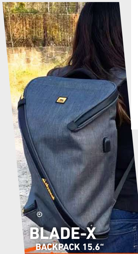
BLADE-X BACKPACK 15.6"