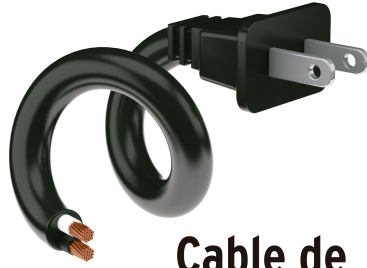
Cable de uso rudo