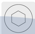
Entrada para llave allen